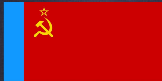
Государственный флаг РСФСР (9 января 1954 — 1 ноября 1991)

Под этим флагом русский народ одержал победу в Великой Отечественной войне 1941–1945 гг.