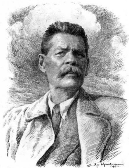
Алексей Максимович ГОРЬКИЙ (1868—1936)

«Без солнца не цветут цветы, без любви нет счастья, без женщины нет любви, без матери нет ни поэта, ни героя».