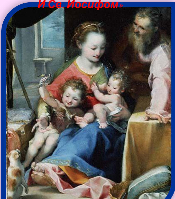
Рембрандт «Мадонна с младенцем и Св. Иосифом»