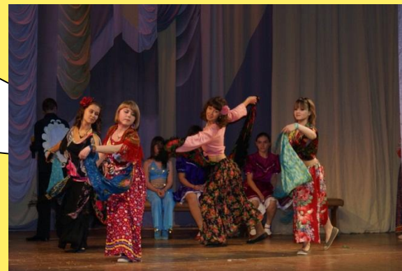
совместные культурные мероприятия