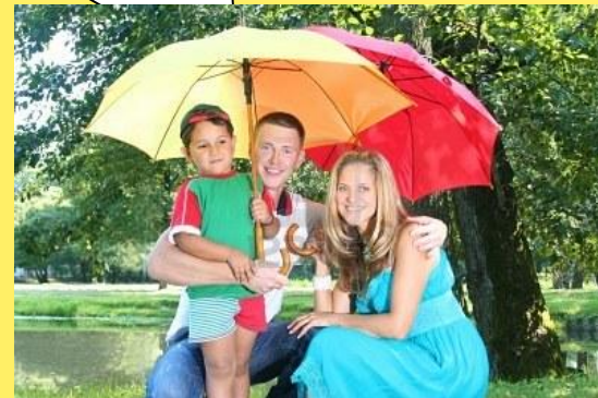
прогулка в парке