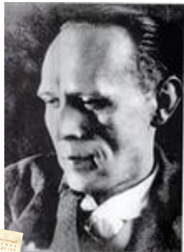
Д. И. ХАРМС

В 1927 году С. Я. Маршак привлек Д.Хармса к работе в детской литературе. Так Хармс получил свои первые публикации и первые деньги от них. С 1928 года Даниил Иванович начинает тесное сотрудничество с детскими журналами «ЧИЖ» и «ЁЖ».