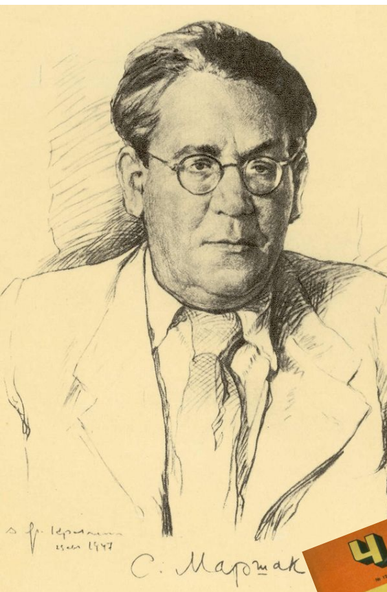
С. Я. МАРШАК

В 1927 году С. Я. Маршак привлек Д.Хармса к работе в детской литературе. Так Хармс получил свои первые публикации и первые деньги от них. С 1928 года Даниил Иванович начинает тесное сотрудничество с детскими журналами «ЧИЖ» и «ЁЖ».