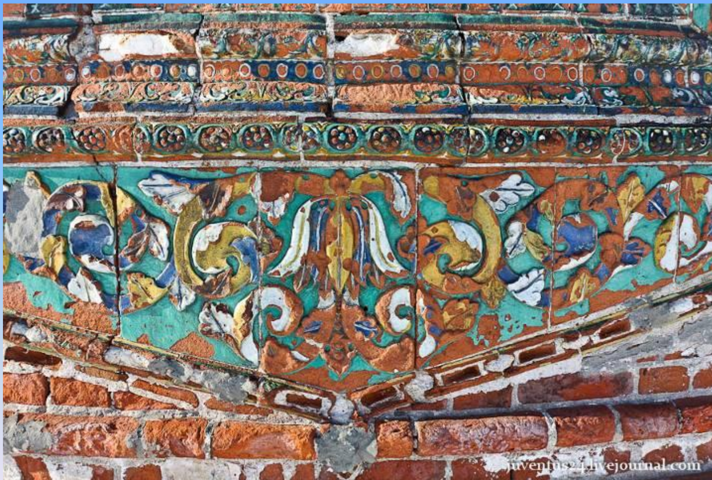
Церковь Иоанна Златоуста (1649 по 1654 г.г.), в Коровниках. Ярославль.