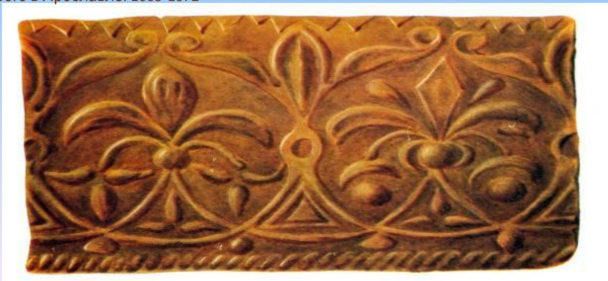
Терракотовая плита в поясе Рождественского собора Ферапонтова монастыря. 1491г.