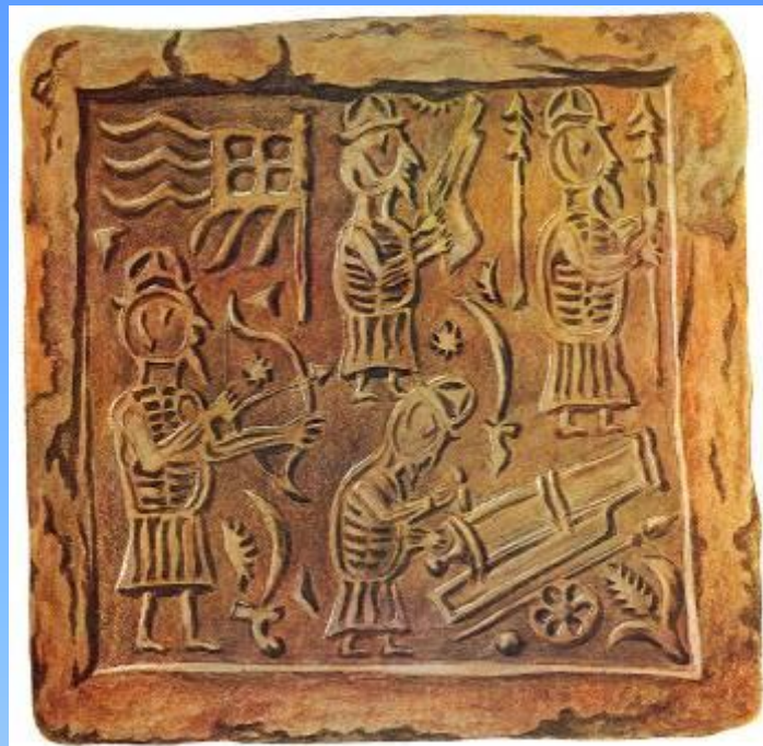
Красный широкорамочный изразец (16 - 17 вв.)