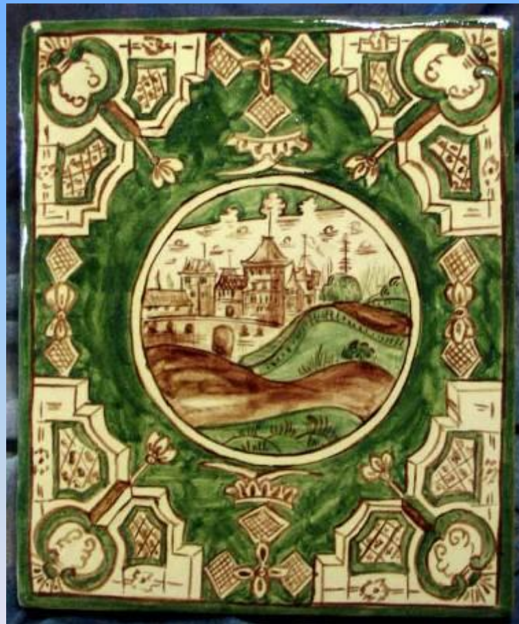
Копии расписных изразцов XIX века