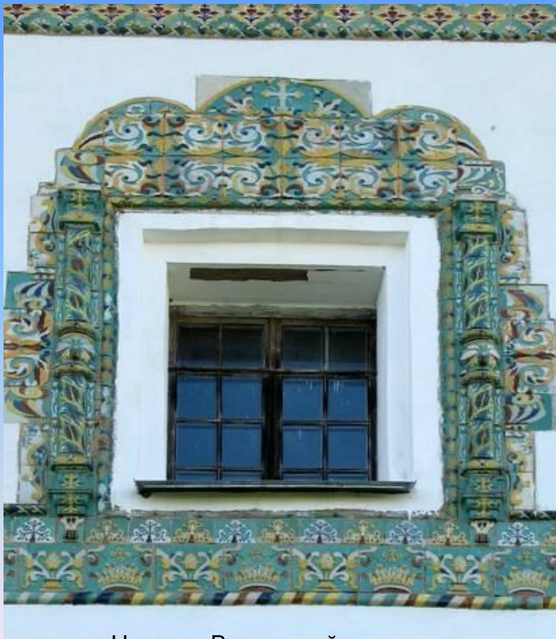
Николо –Вяжицкий монастырь