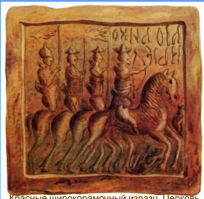
Красные широкорамочный изразц. Церковь Николы Мокрого в Ярославле. 1665-1672