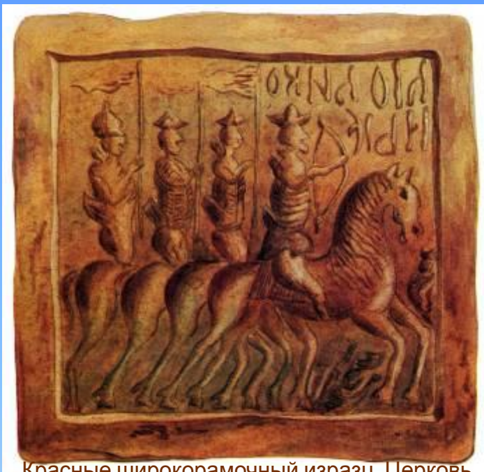
Красные широкорамочный изразц. Церковь Никола Мокрого в Ярославле. 1665-1672