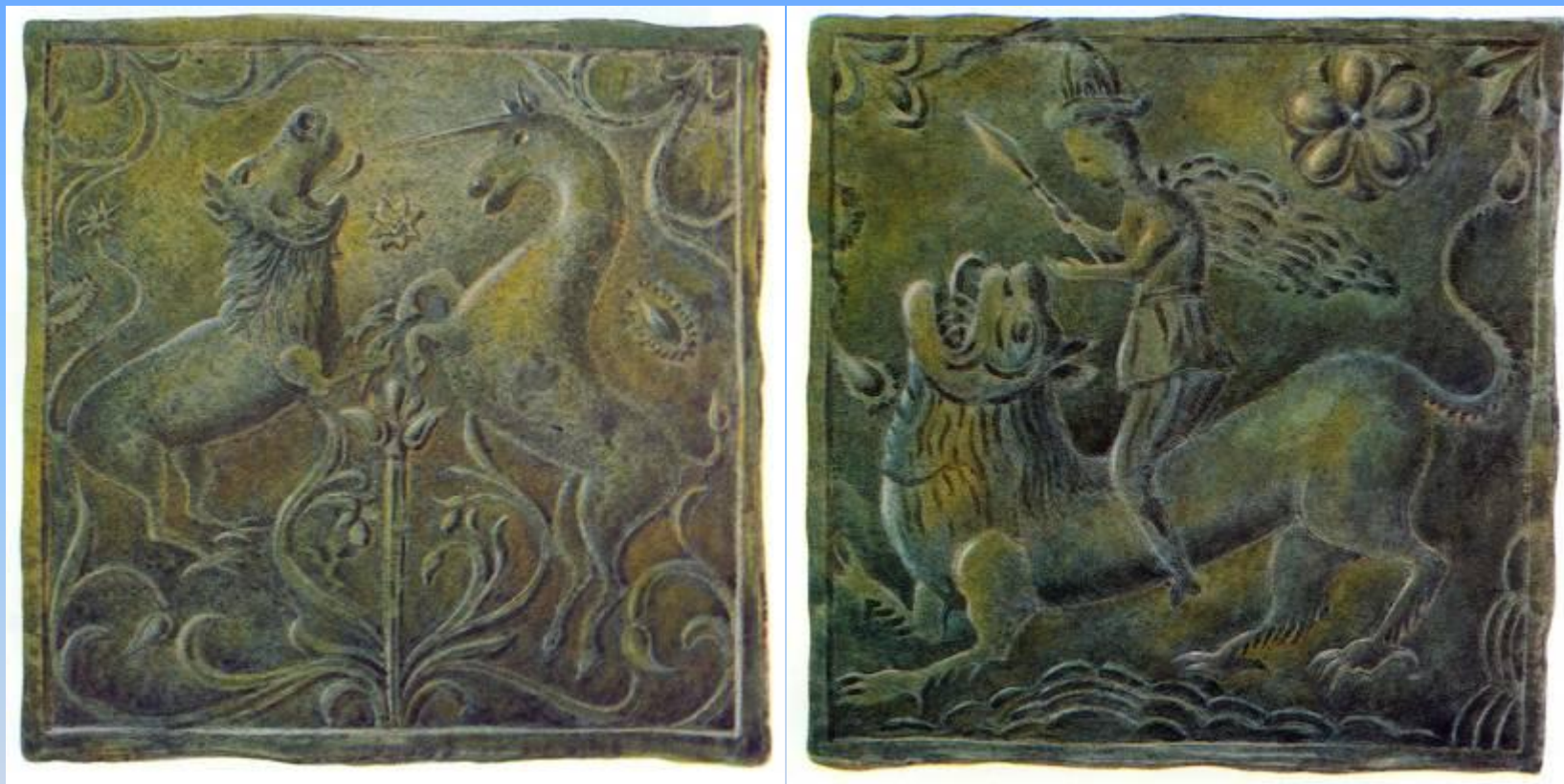
Муравленные изразцы Московского производства в декоре паперти трапезной палаты Борисоглебского монастыря. 90-е годы 17 в.