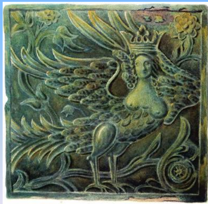
Декор паперти трапезной палаты Борисоглебского монастыря (конец XVII в.)