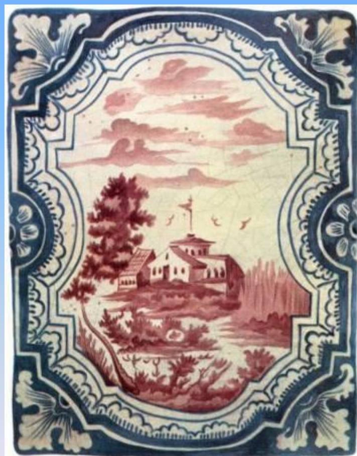
Старинный изразец из Кирилло-Белозерского монастыря