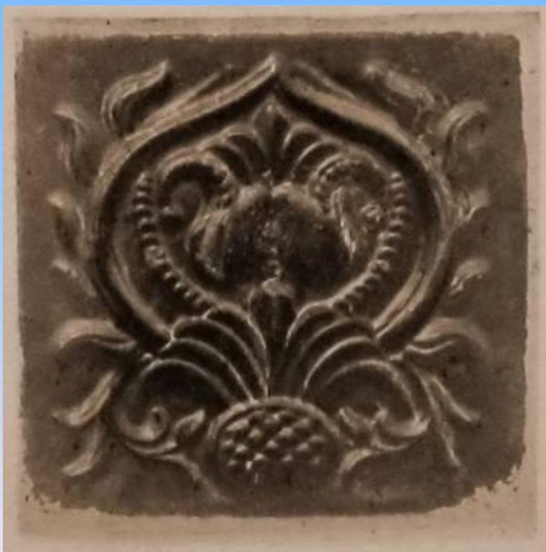
Церковь Воскресения Христова в Ростове (конецXVIIв.)