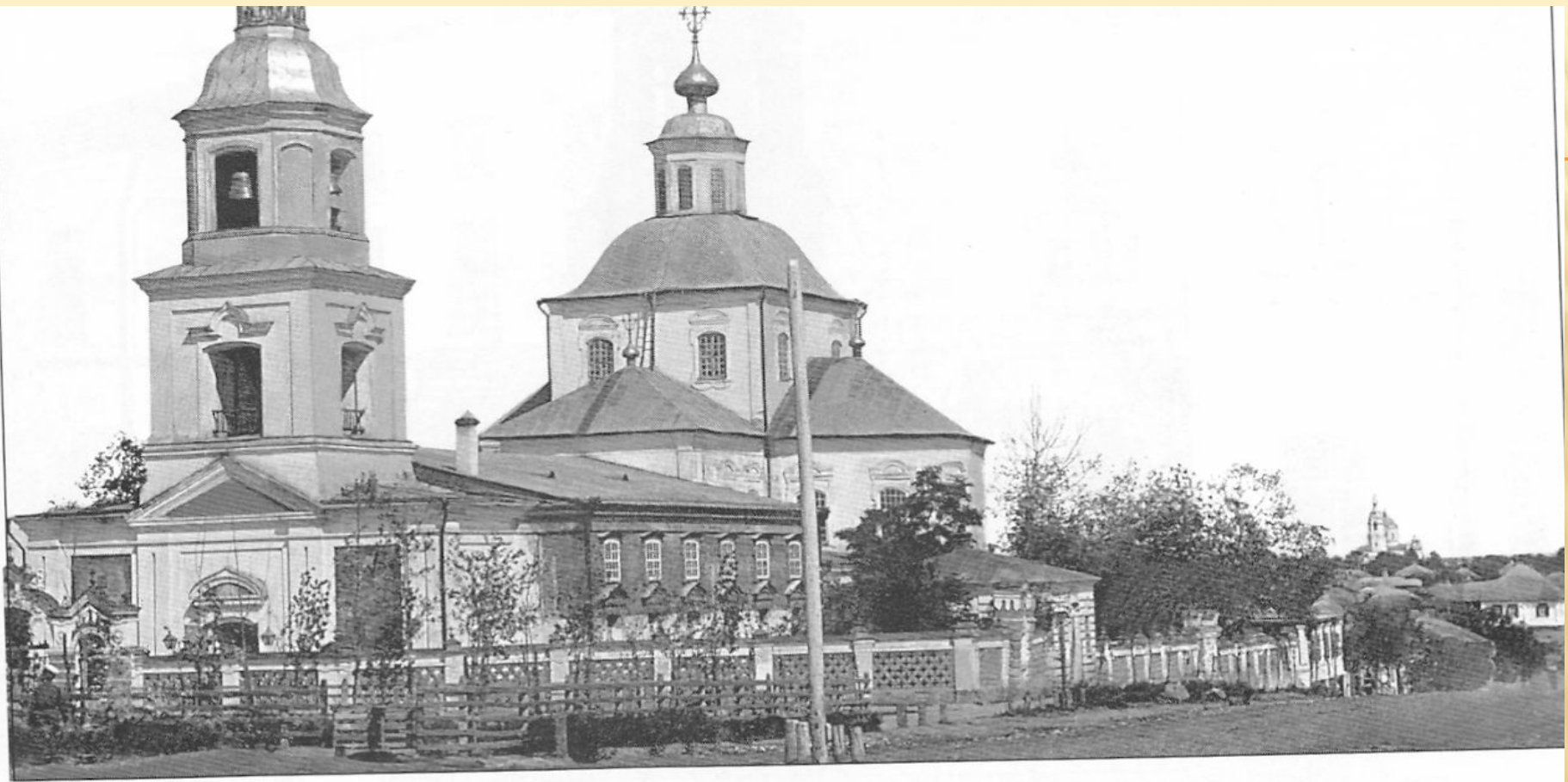
Ил. 10. Церковь Богоявления. Фотография нач. XX в.

ЦЕРКОВЬ БОГОЯВЛЕНСКАЯ. НАЧАЛО XX ВЕКА. ОДНО ИЗ ПЕРВЫХ КАМЕННЫХ ЗДАНИЙ ГОРОДА (ОК. 1711 Г.). СЕЙЧАС НА ЭТОМ МЕСТЕ НАХОДИТСЯ ДОМ КУЛЬТУРЫ.