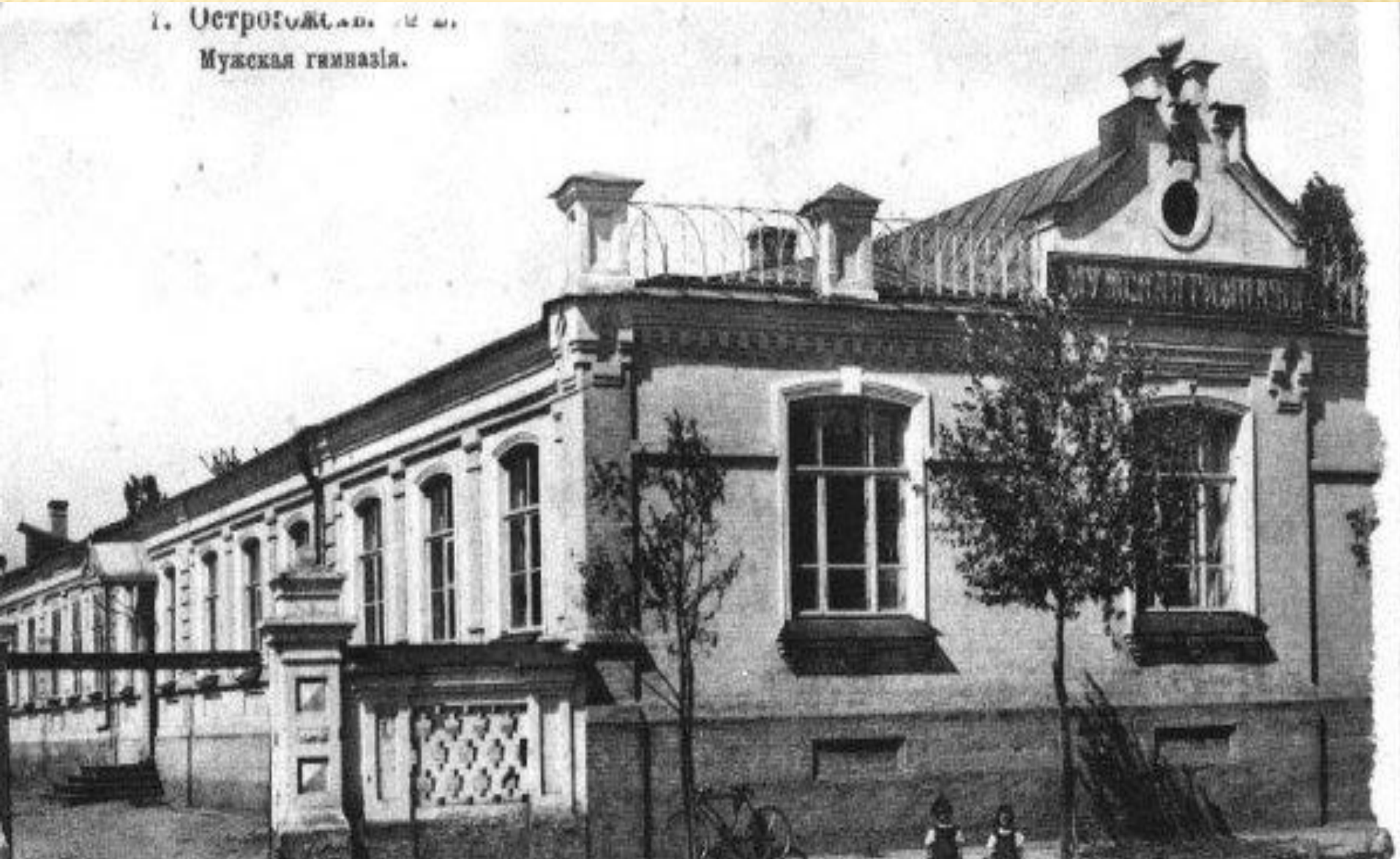
г. Острогожск. М. М. Мужская гимназия.