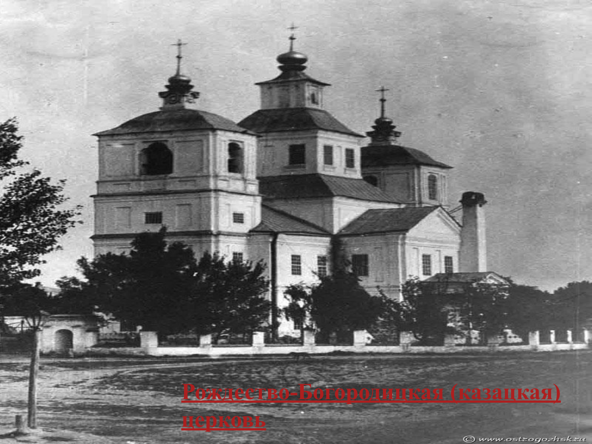
Рождество-Богородицкая (казацкая) церковь