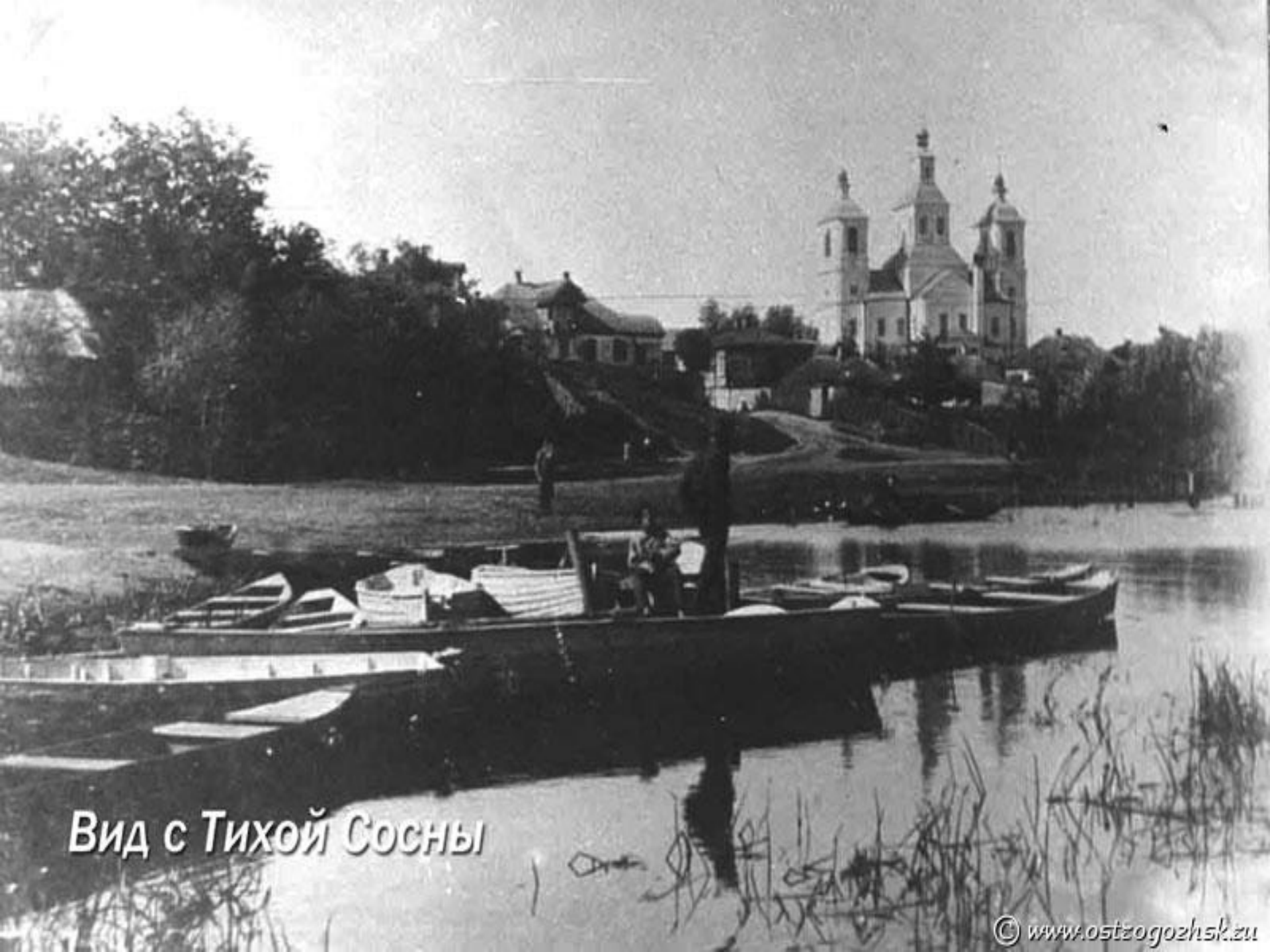
Вид с Тихой Сосны