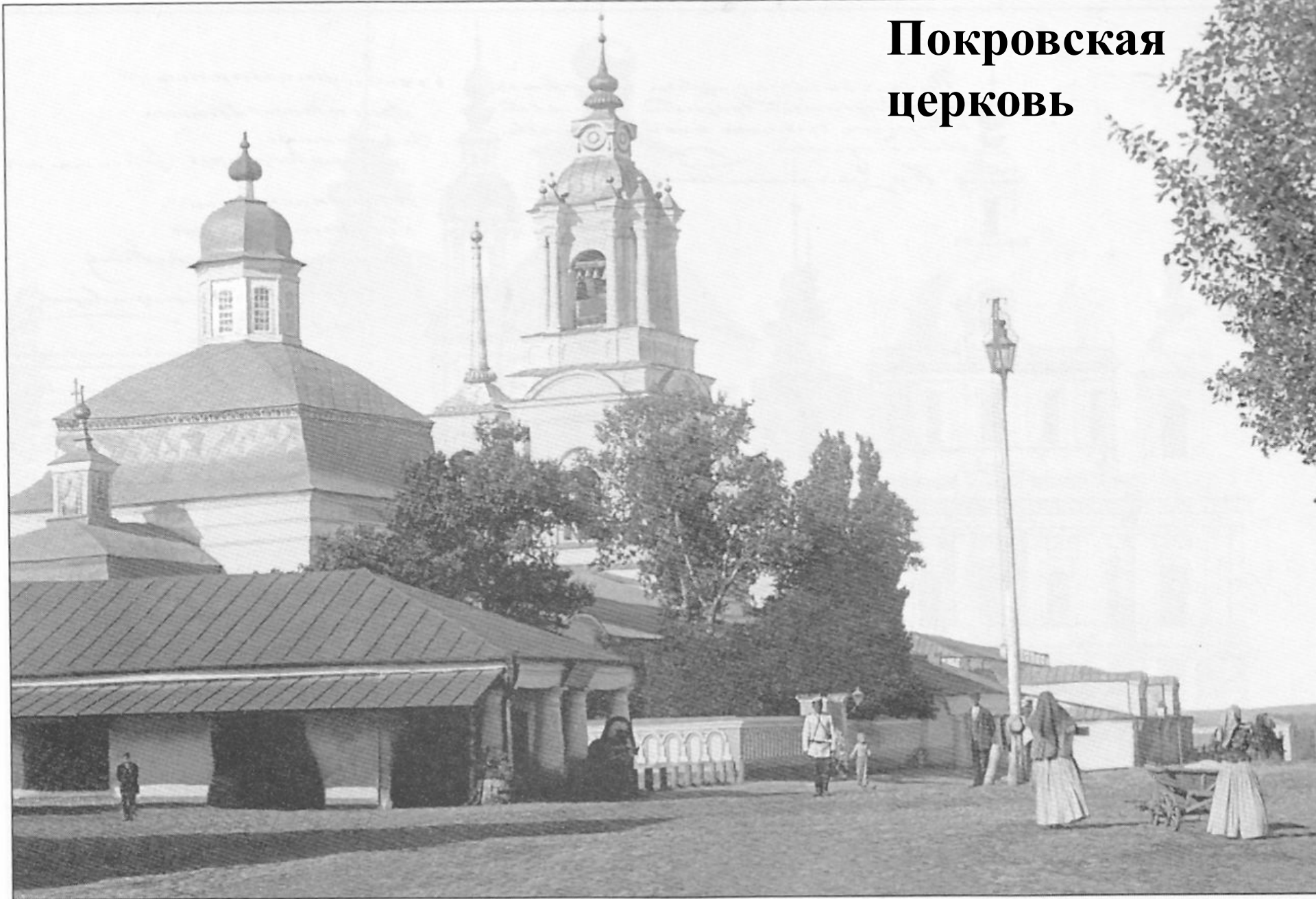
Ил. 5. Покровская церковь и общественная галерея. Фотография нач. XX в.