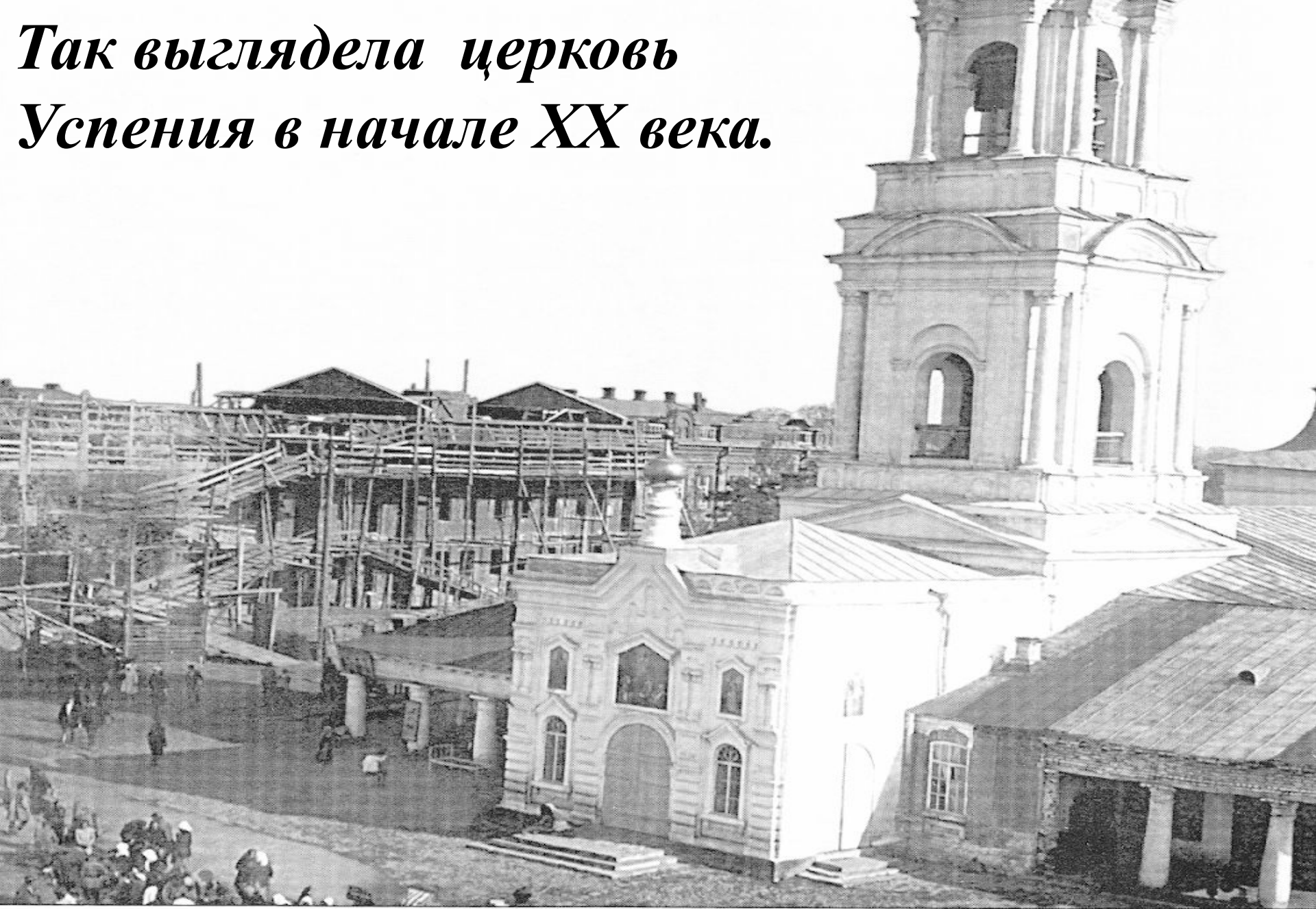
Ил. 4. Церковь Успения. Фотография нач. XX в.