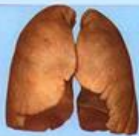
Лёгкие человека некурящего

В лёгких при курении постепенно скапливается дым и сажа.