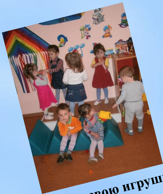
Найди свою игрушку