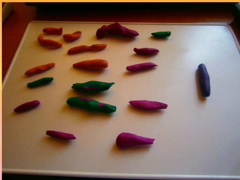
«Палочки для Ваньки-встаньки»