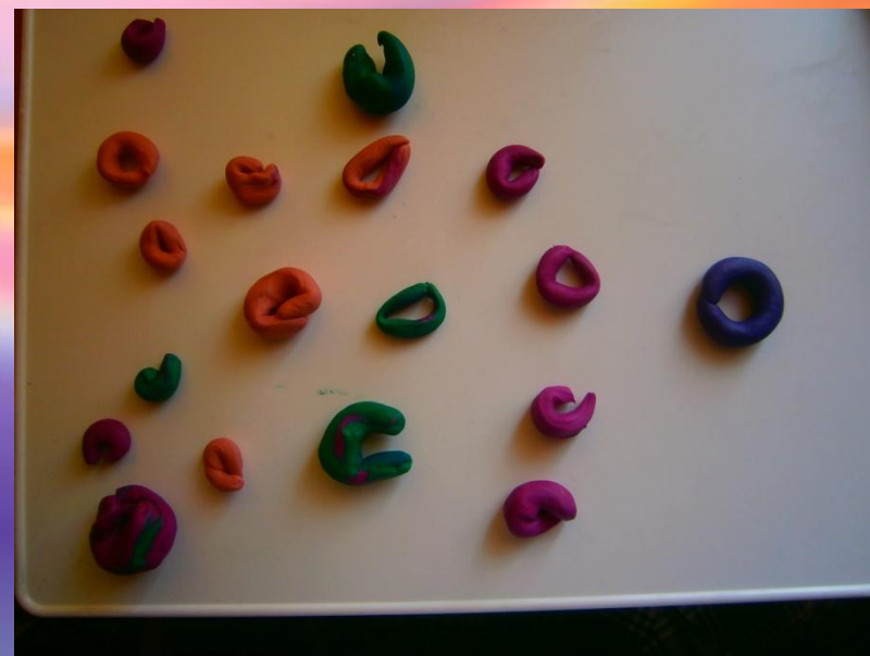
«Колечки для матрешки»