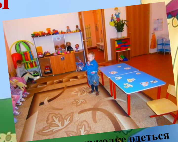
Поможем куколке одеться