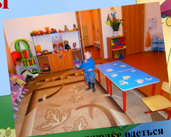
Поможем куколке одеться