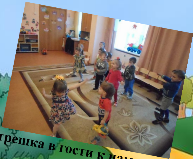
Матрешка в гости к нам пришла