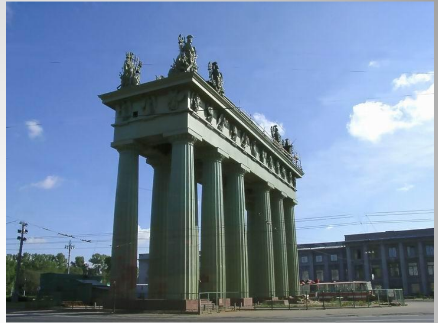
Московские триумфальные ворота в Петербурге Архитектор В.П. Стасов