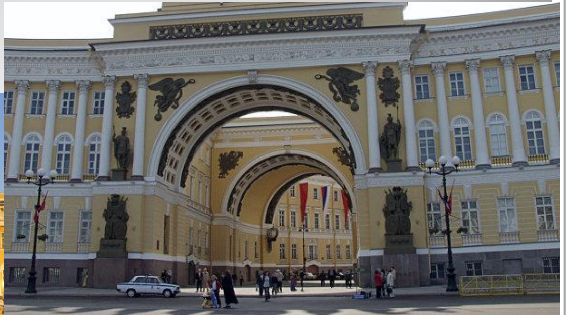
Арка Главного штаба Архитектор К.И. Росси