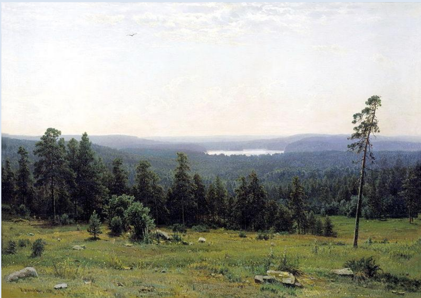
Шишкин И.И. «Лесные дали»