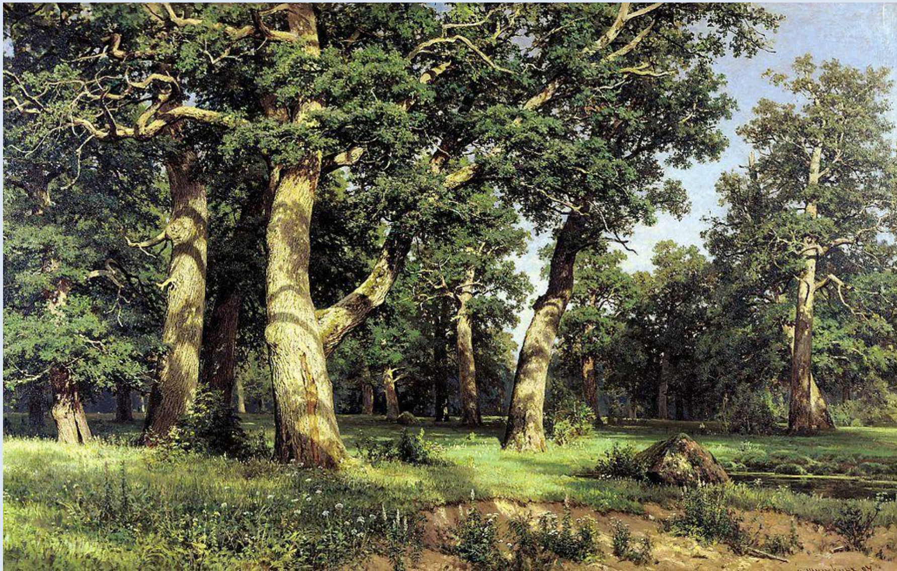
Шишкин И.И. «Дубовая роща».