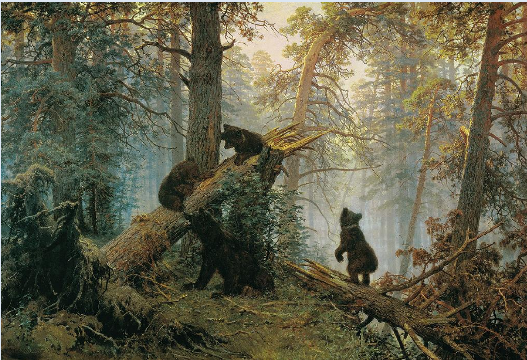
Шишкин И.И. «Утро в сосновом бору».