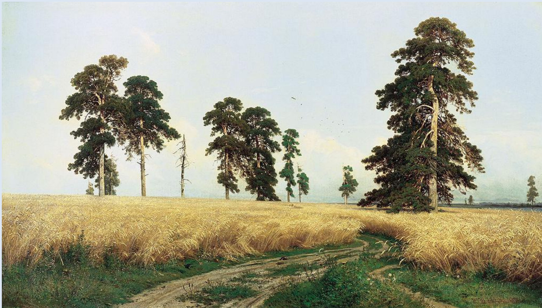
Шишкин И.И. «Рожь».