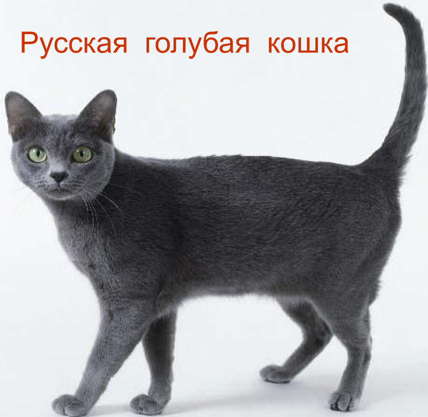
Русская голубая кошка

На Руси кошки появились в начале XIII века.