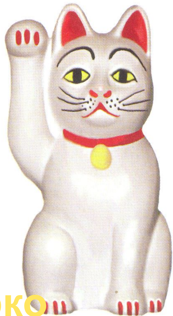
Манэки Нэко ( манящий кот )