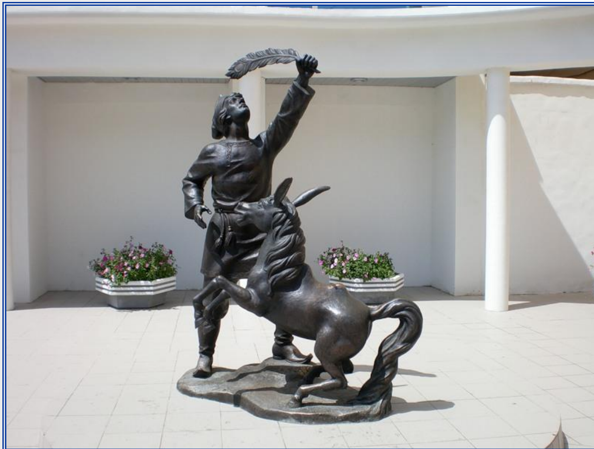
Памятник Коньку-Горбунку в Астрахани