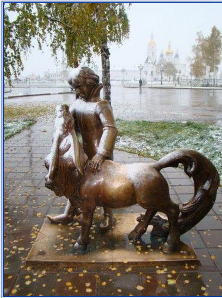
Памятник Коньку-Горбунку в Тобольске