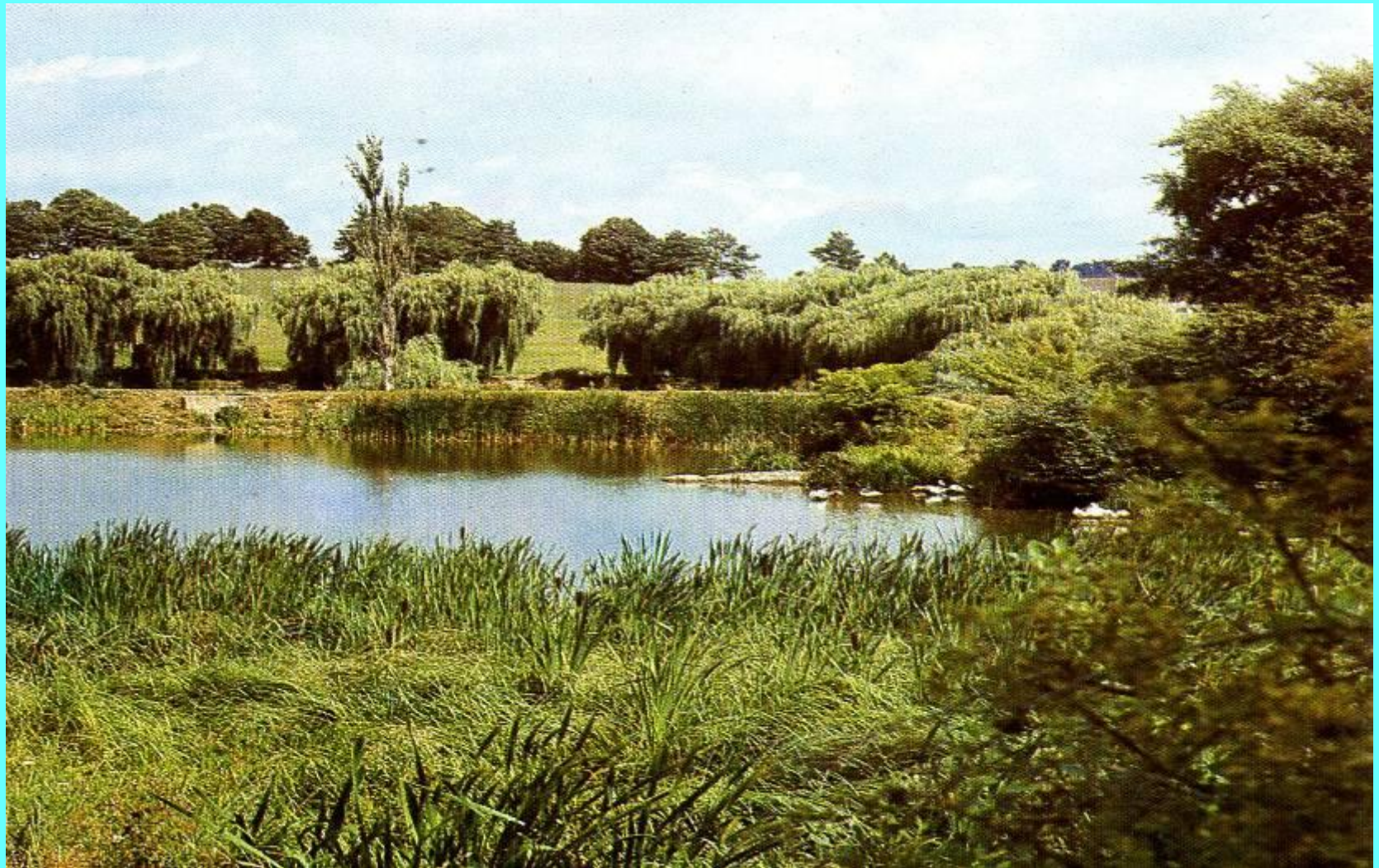
Старый парк в Немирове.