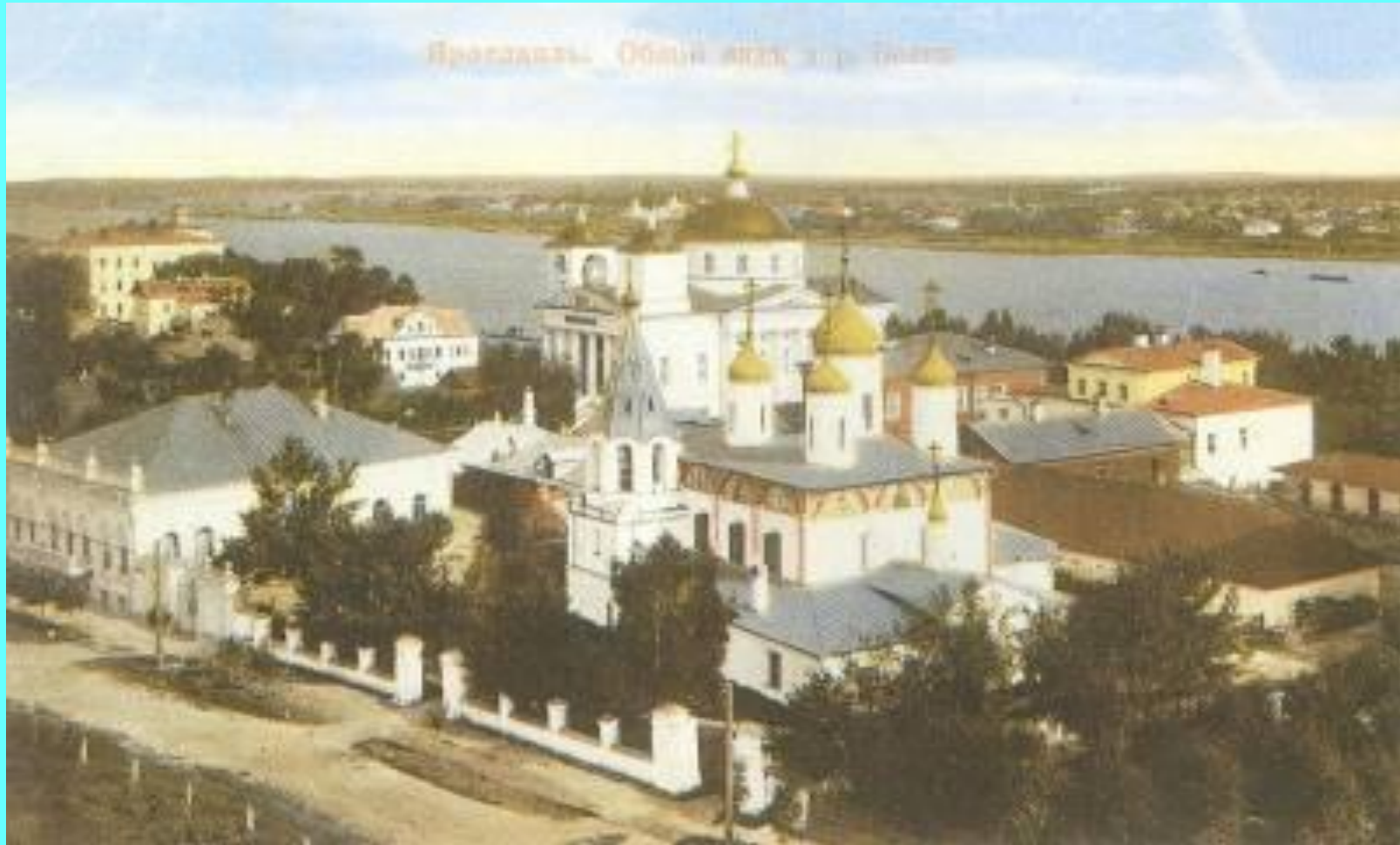
Ярославль. Общий вид и река Волга.