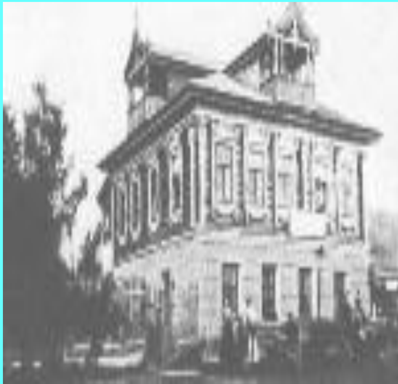
Дом-усадьба в Грешнёво