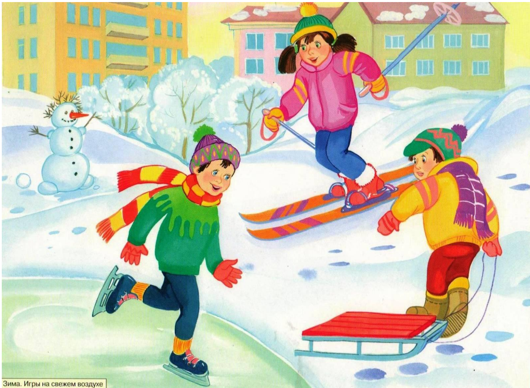
Зима. Игры на свежем воздухе