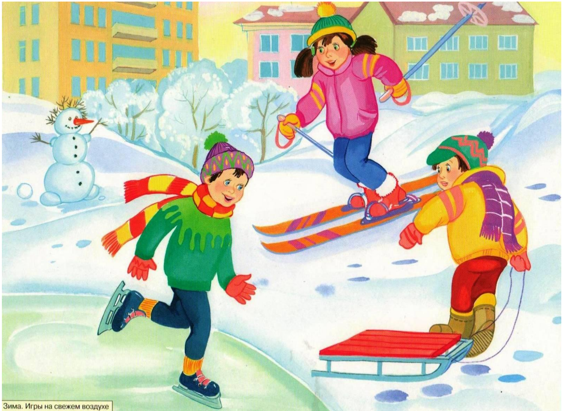
Зима. Игры на свежем воздухе