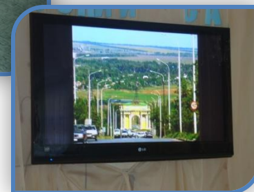
Знакомимся с любимым городом