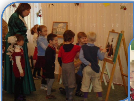
Знакомимся с бытом казаков