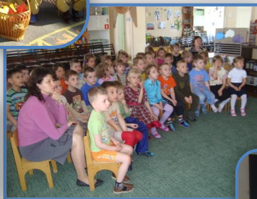
Любимый город – Новочеркасск