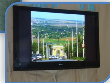
Знакомимся с любимым городом