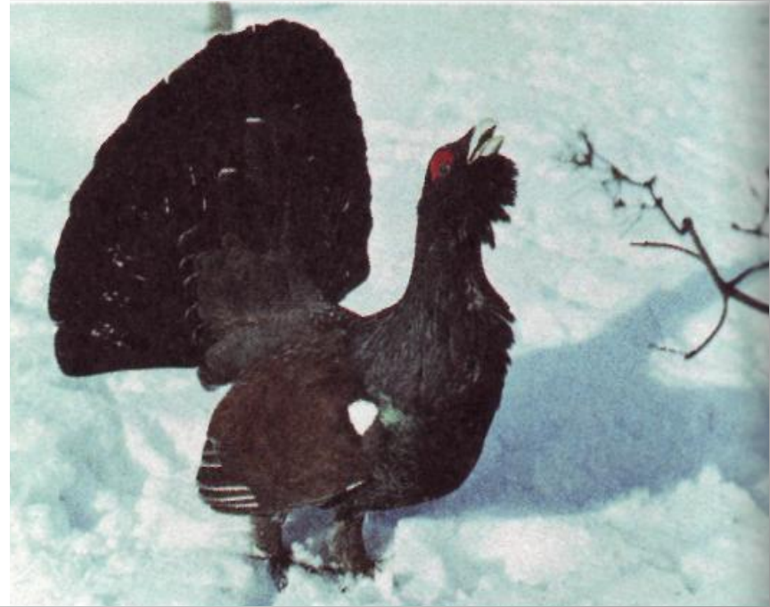
Лебедь и глухарь