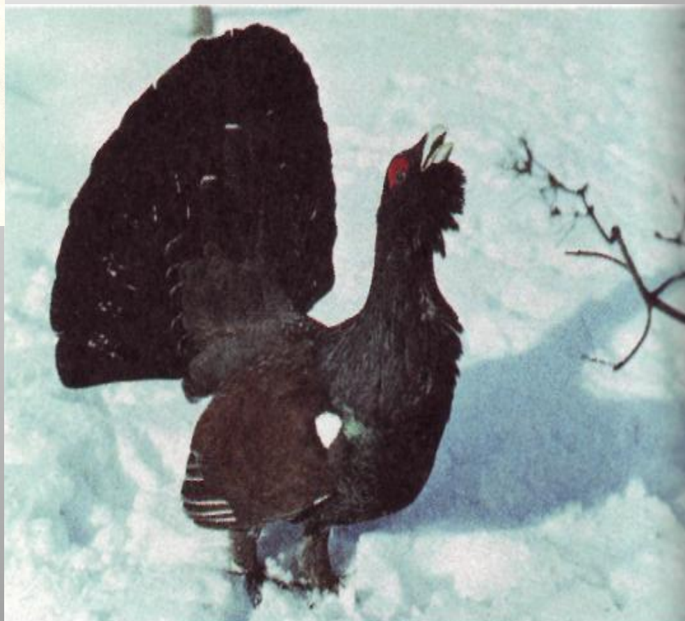
Тетерев и глухарь