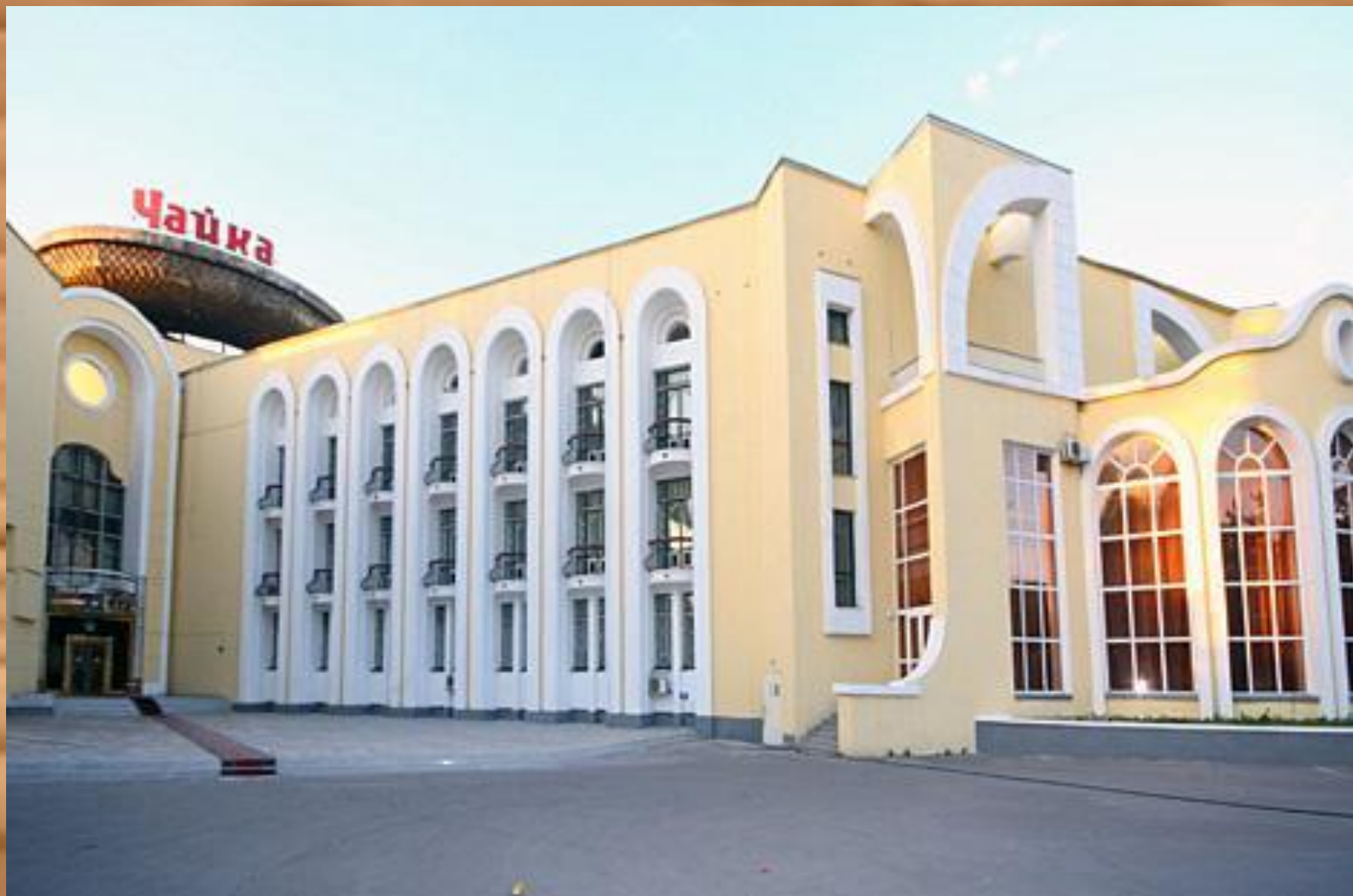
«Чайка» қонақ үйі