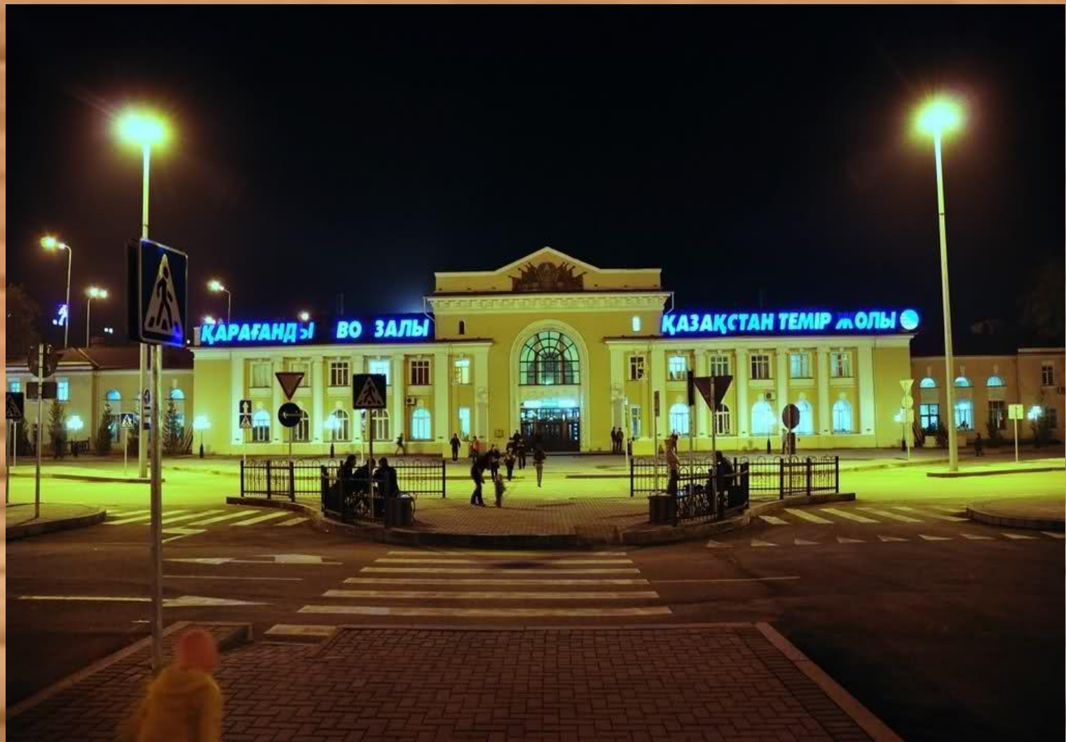
Қарағанды теміржол вокзалы