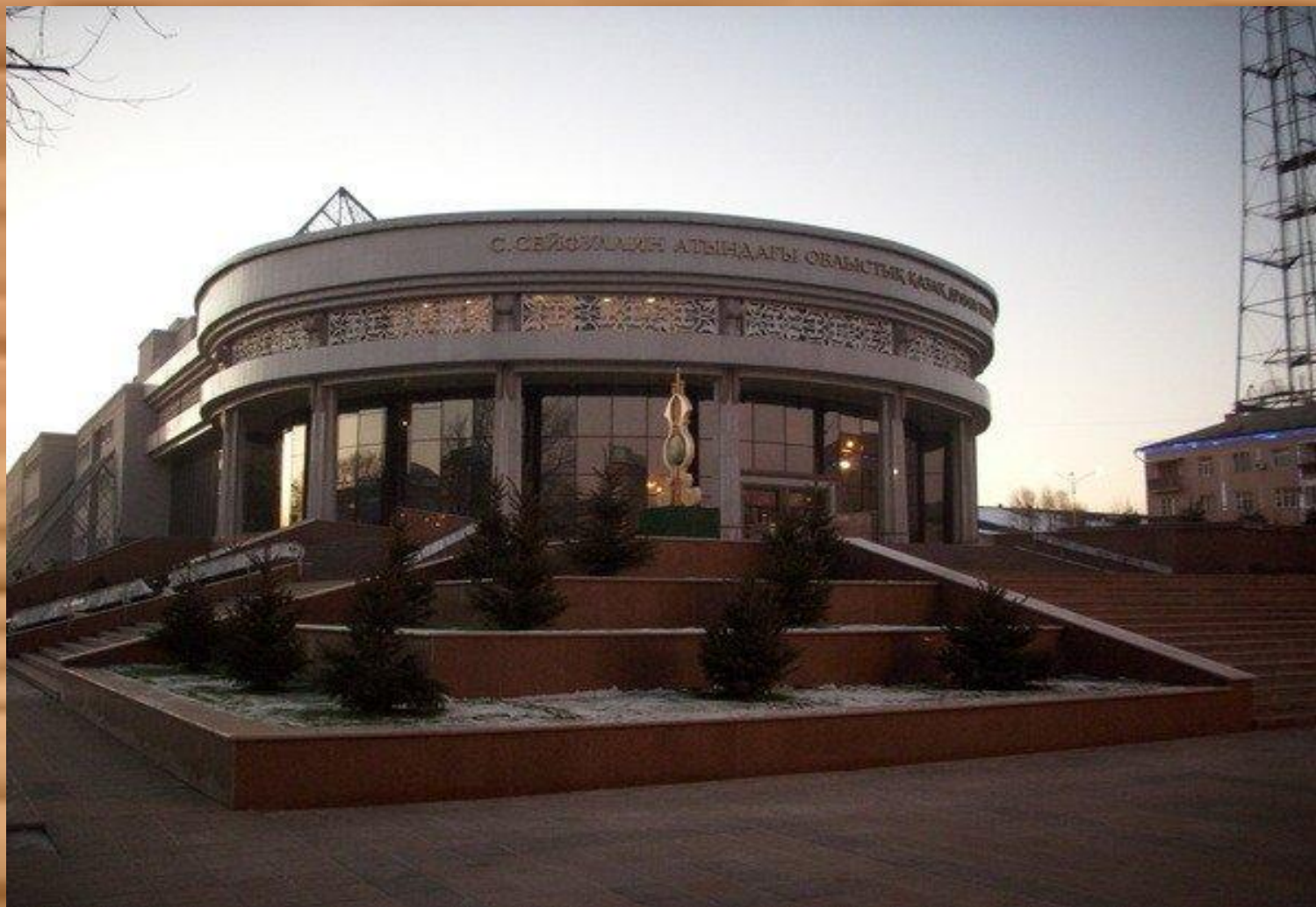
С.Сейфуллин атындағы қазақ драма театры