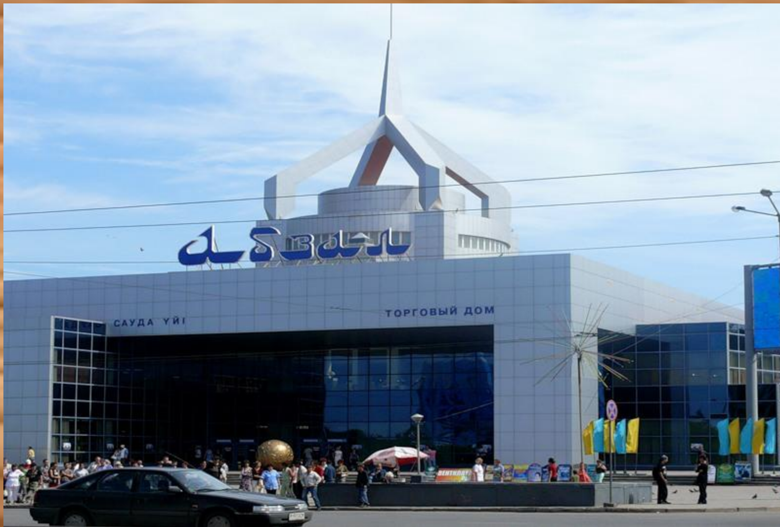
«Абзал» сауда үйі