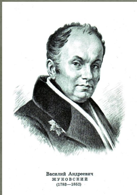
Василий Андреевич ЖУКОВСКИЙ (1783—1852)

Ведь до этого творчество не приносило Гоголю успеха.