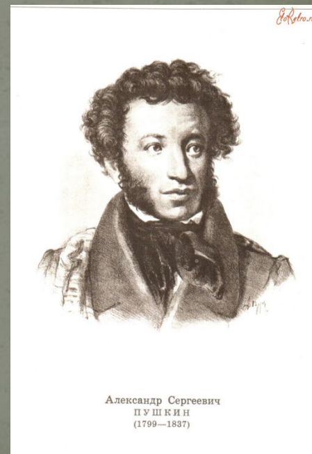
Александр Сергеевич ПУШКИН (1799—1837)

В 1831 году Гоголь знакомится с представителями литературных кругов Жуковского и Пушкина, бесспорно эти знакомства сильно повлияли на его дальнейшую судьбу и литературную деятельность.