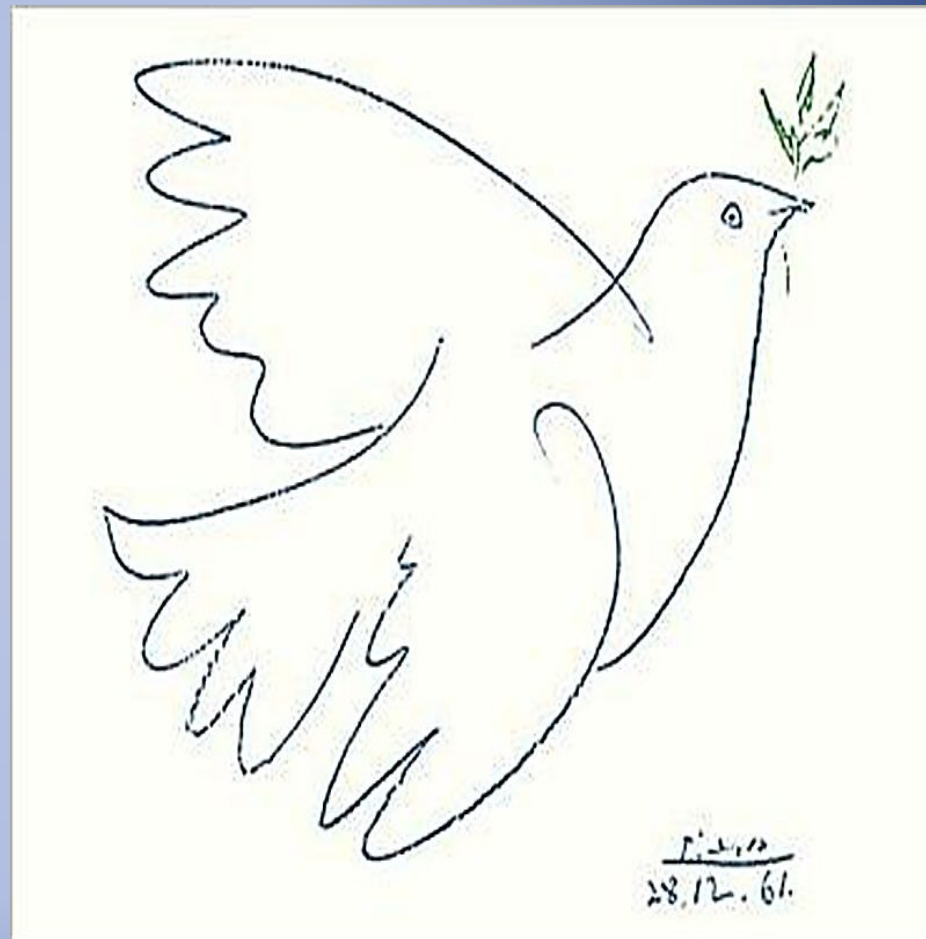
Рисунок 1961 года