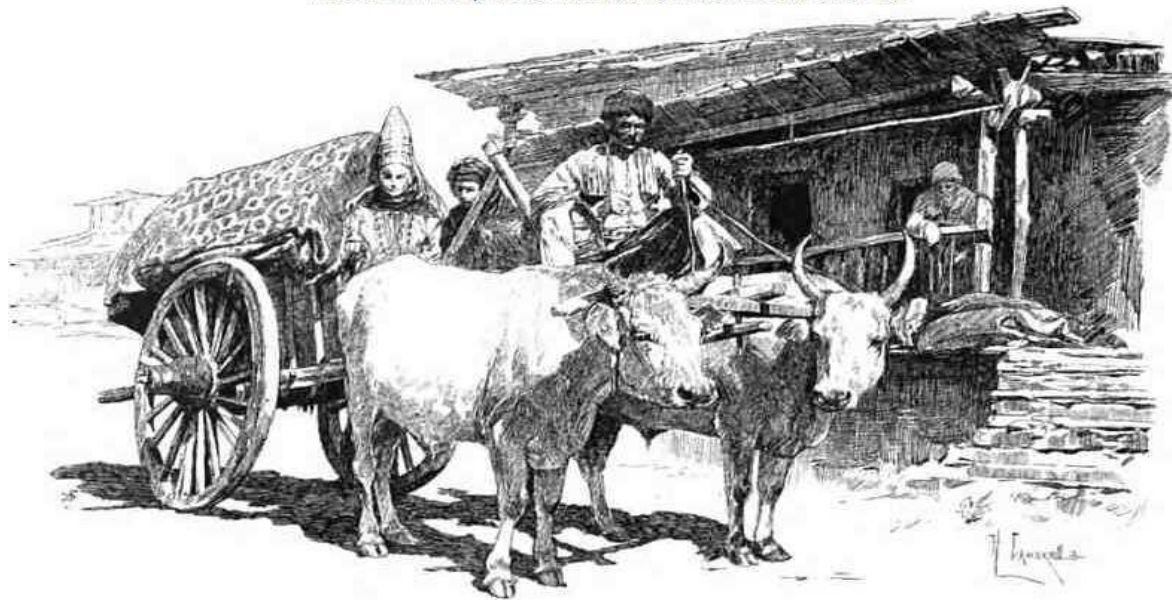
Рис. из книги В. Кривенко "Поездка на Кавказ осенью 1888 года"