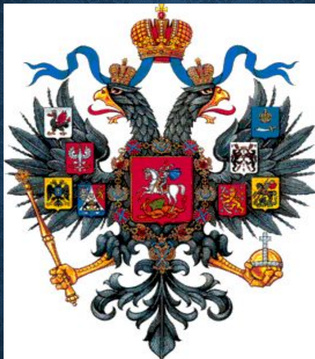
Рисунок Малого герба России, исполненный Александром Фадеевым, был высочайше утвержден 8 декабря 1856 года. Этот вариант герба отличался от предшествующих не только изображением орла, но и количеством "титульных" гербов на крыльях.