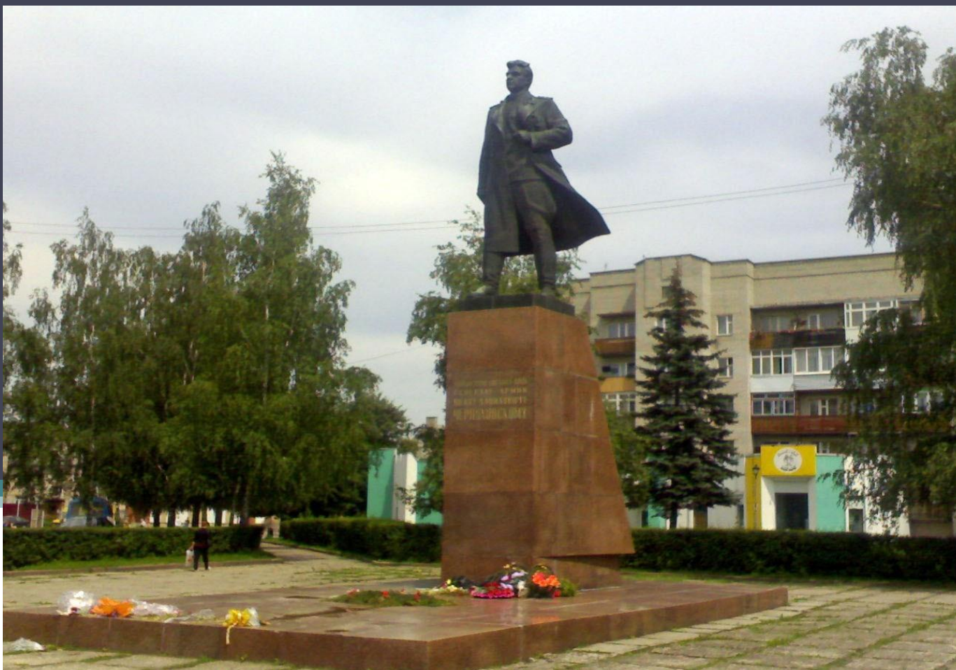
Памятник И.Д. Черняховского в Черняховске