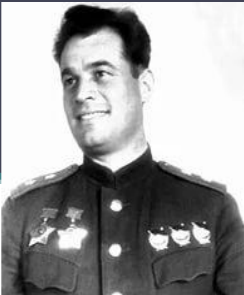
Иван Данилович Черняховский (1906 – 1945)