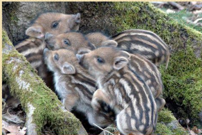
Дикие поросята рождаются полосатыми.