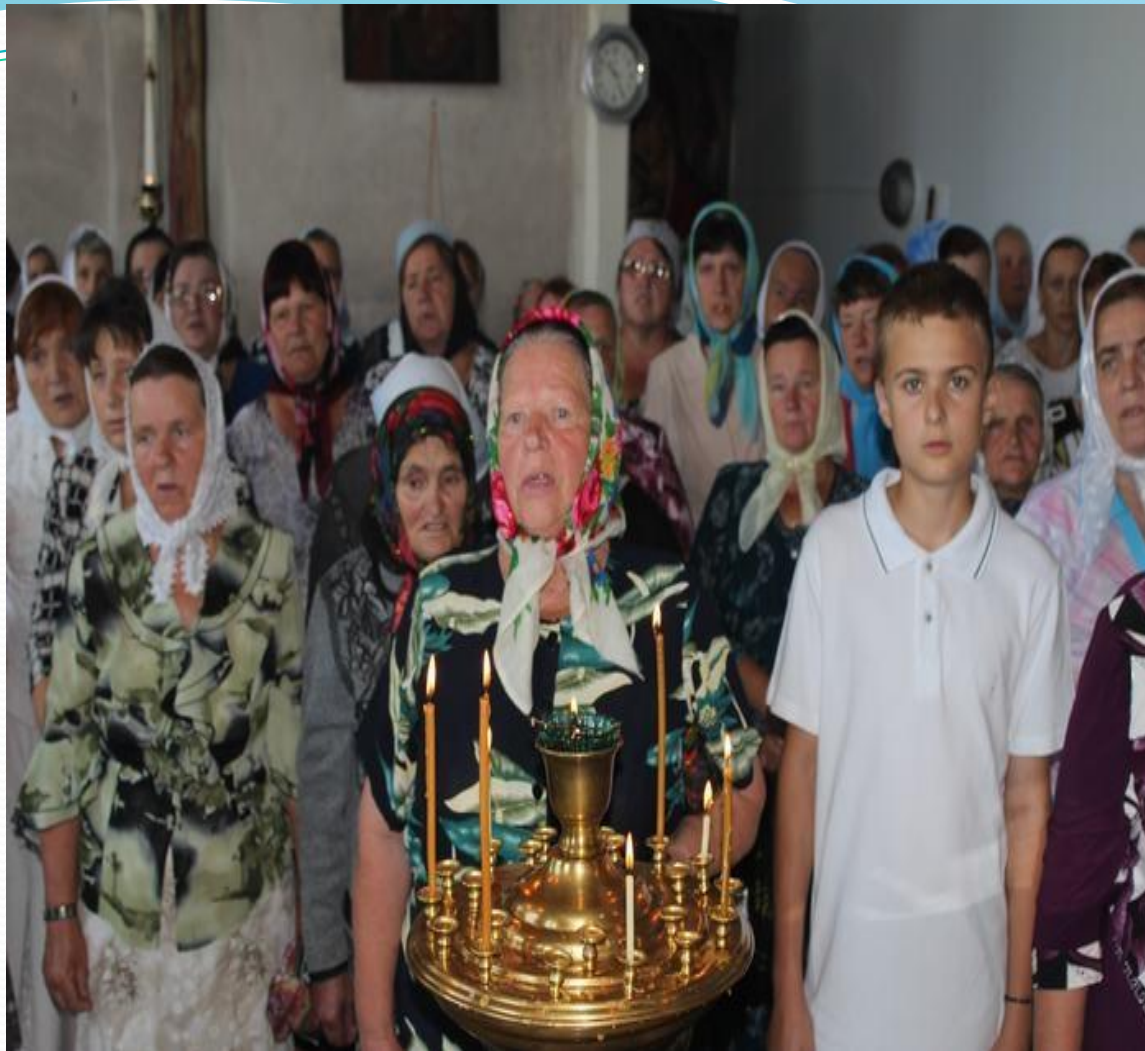
На службе в церкви с. Криуши Вознесенского района