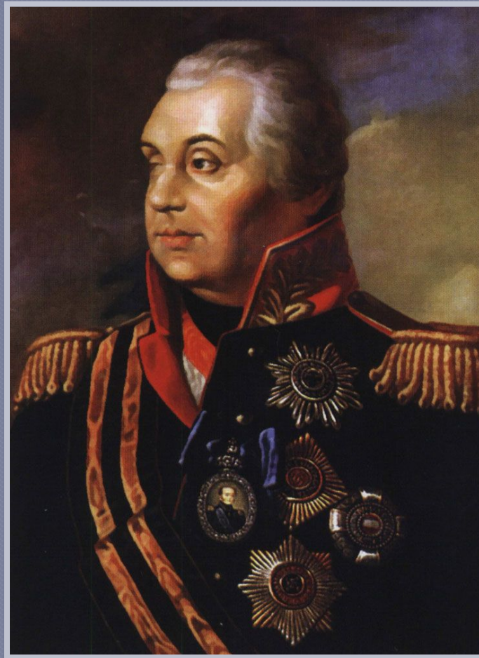
Михаил Илларионович Кутузов