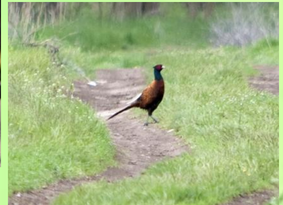
! фаза н