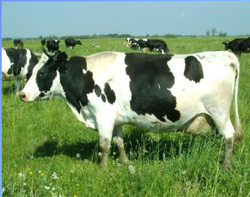
Голландская порода коров