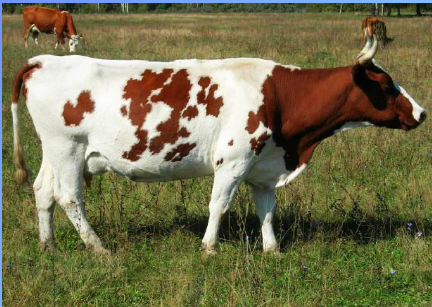
Красная степная порода коров