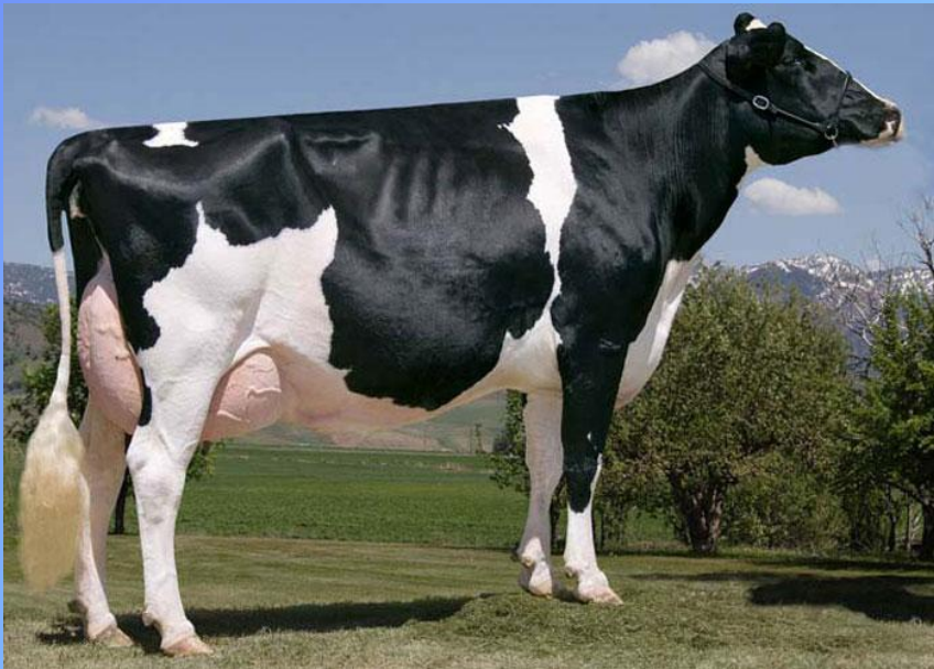
Черно-пестрая порода коров