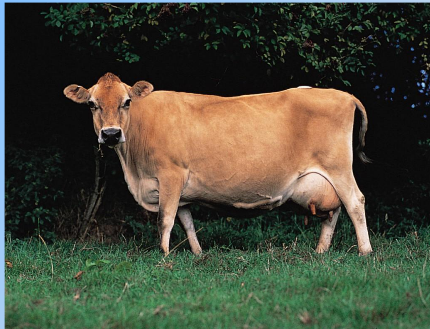
Симментальская порода коров