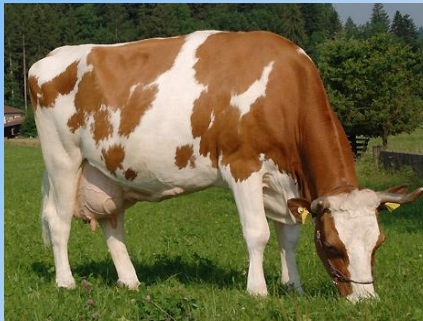
Айширская порода коров