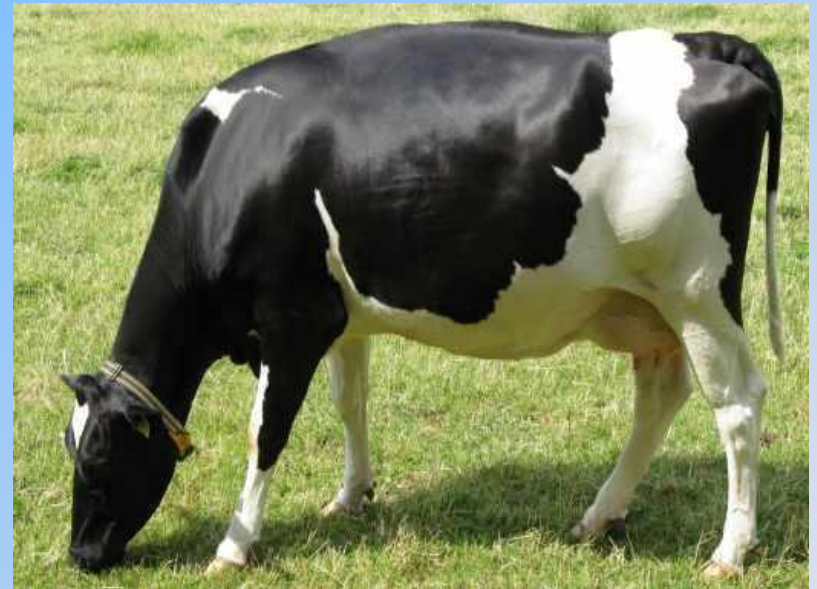
Джерсейская порода коров