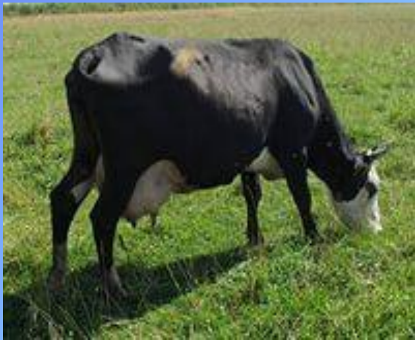
Ярославская порода коров