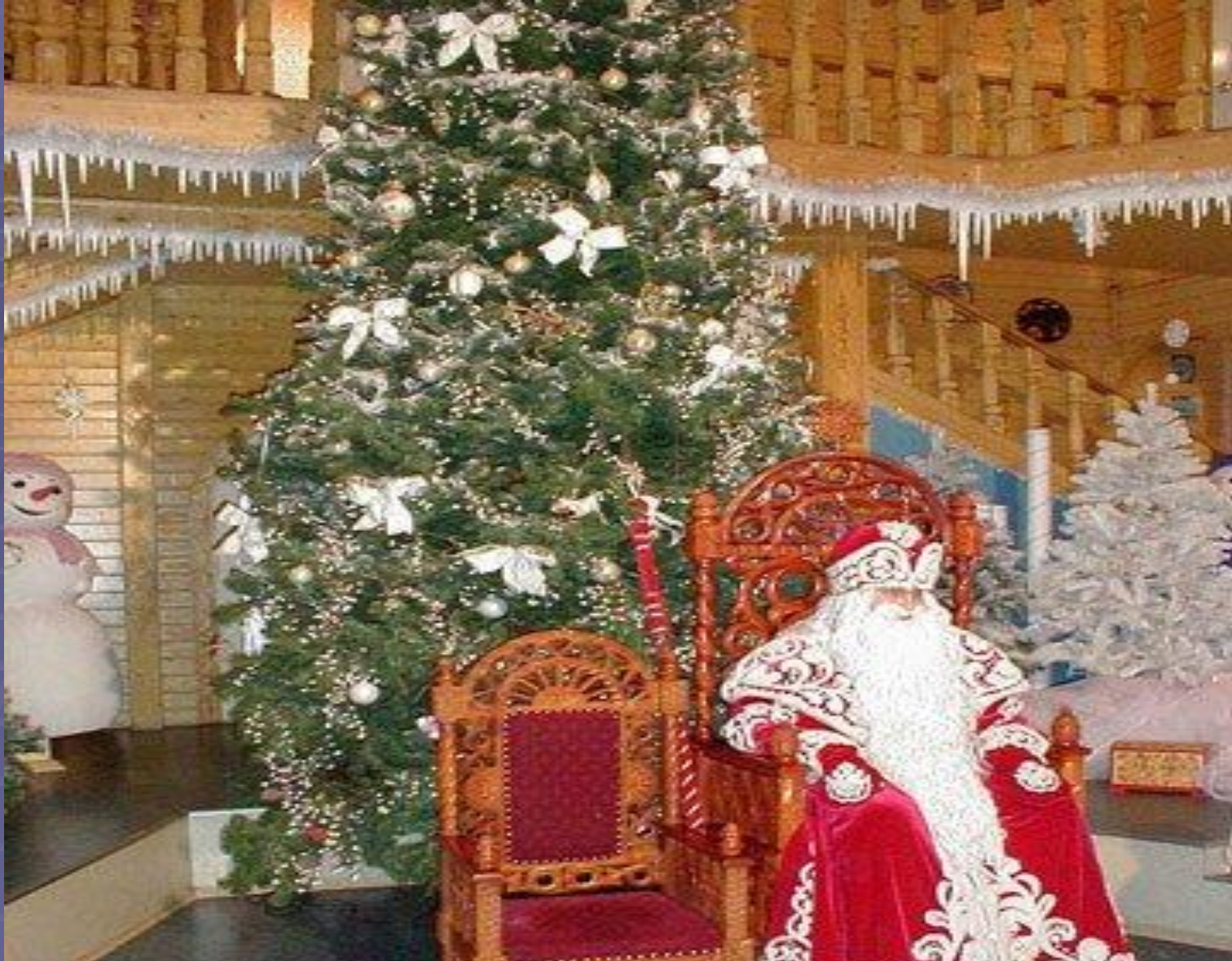
А прямо посередине терема ёлка стоит. Вся в оушках, гирляндах, со снежинкой на макушке. А ней трон, на котором Дед Мороз восседает, гост встречает.