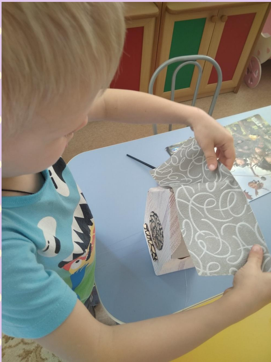
Приклеиваем крышу. птичкам.