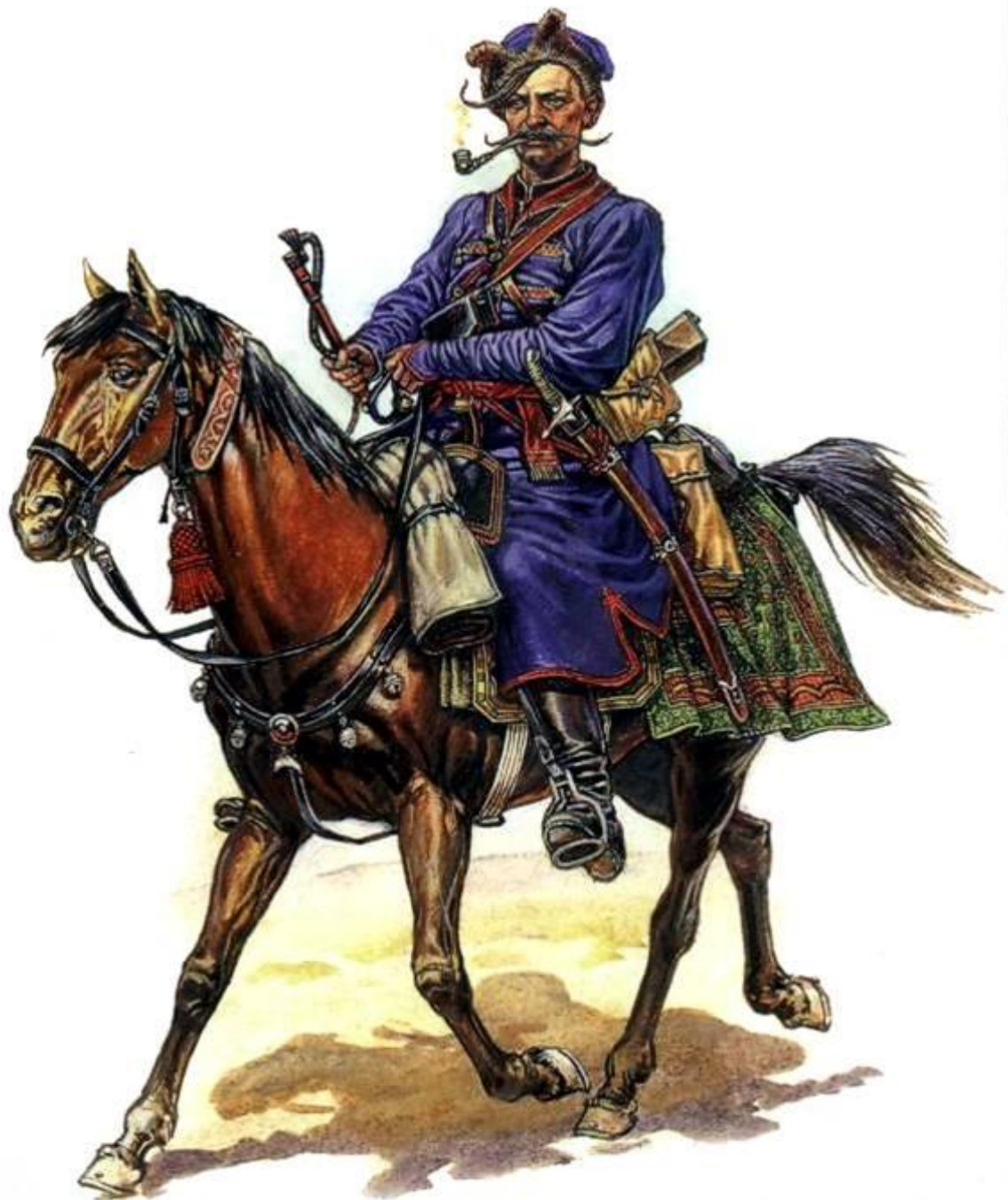
Регистровый казак конной сотни