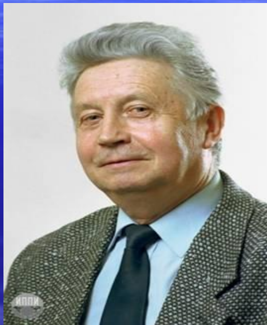
2. Сергей Владимирович Михалков