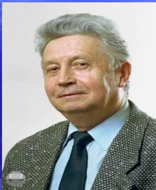
2. Сергей Владимирович Михалков