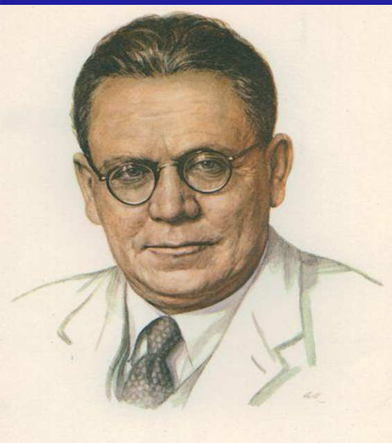
3. Самуил Яковлевич Маршак