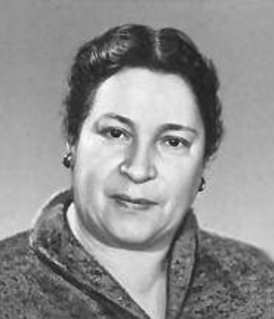
1. Агния Львовна Барто