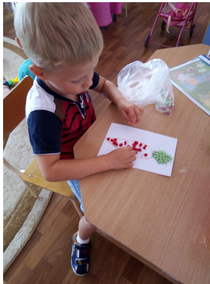
Аппликация из салфеток