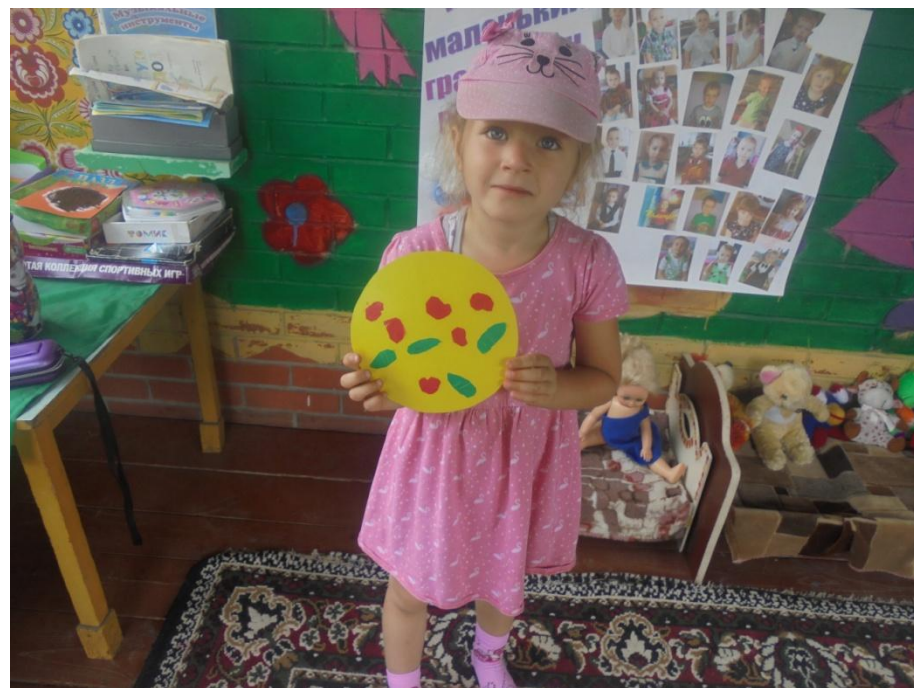
Аппликация «Овощи на