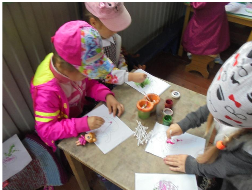
Рисование овощей в нетрадиционной технике рисования