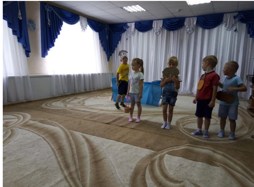
Театральное представление «Таня и овощи»