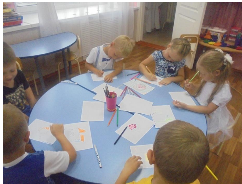
Рисование «Корзина с овощами»