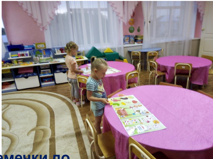
Лепбук «От семечки до