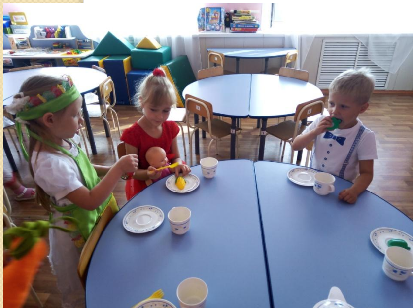
Сюжетно-ролевая игра «Кафе»