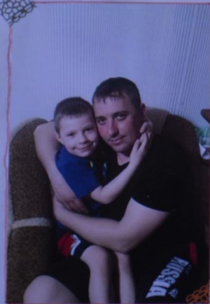
так папа меня любит...)