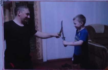
а так мы играем...)