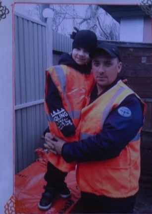
а это мы с папой собираемся на работу...)