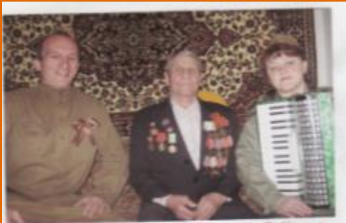
Акция «Салют Победы» поздравление ветеранов 2011 год

Ведущая городских праздников ДК «Металлург», ДК «Хим