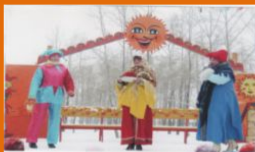
Масленица 2011 год