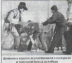
Детишки и взрослые участвовали в конкурсах и получили призы за победу