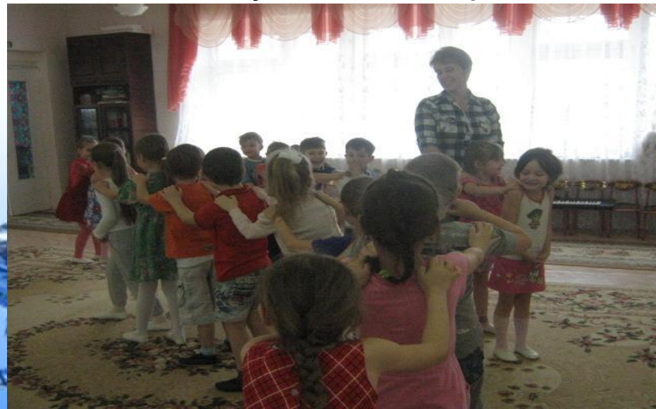
«Ручейки и озёра»