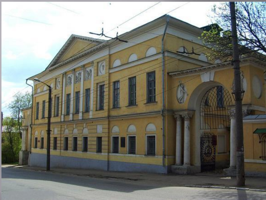
ОБЛАСТНОЙ КРАЕВЕДЧЕСКИЙ МУЗЕЙ