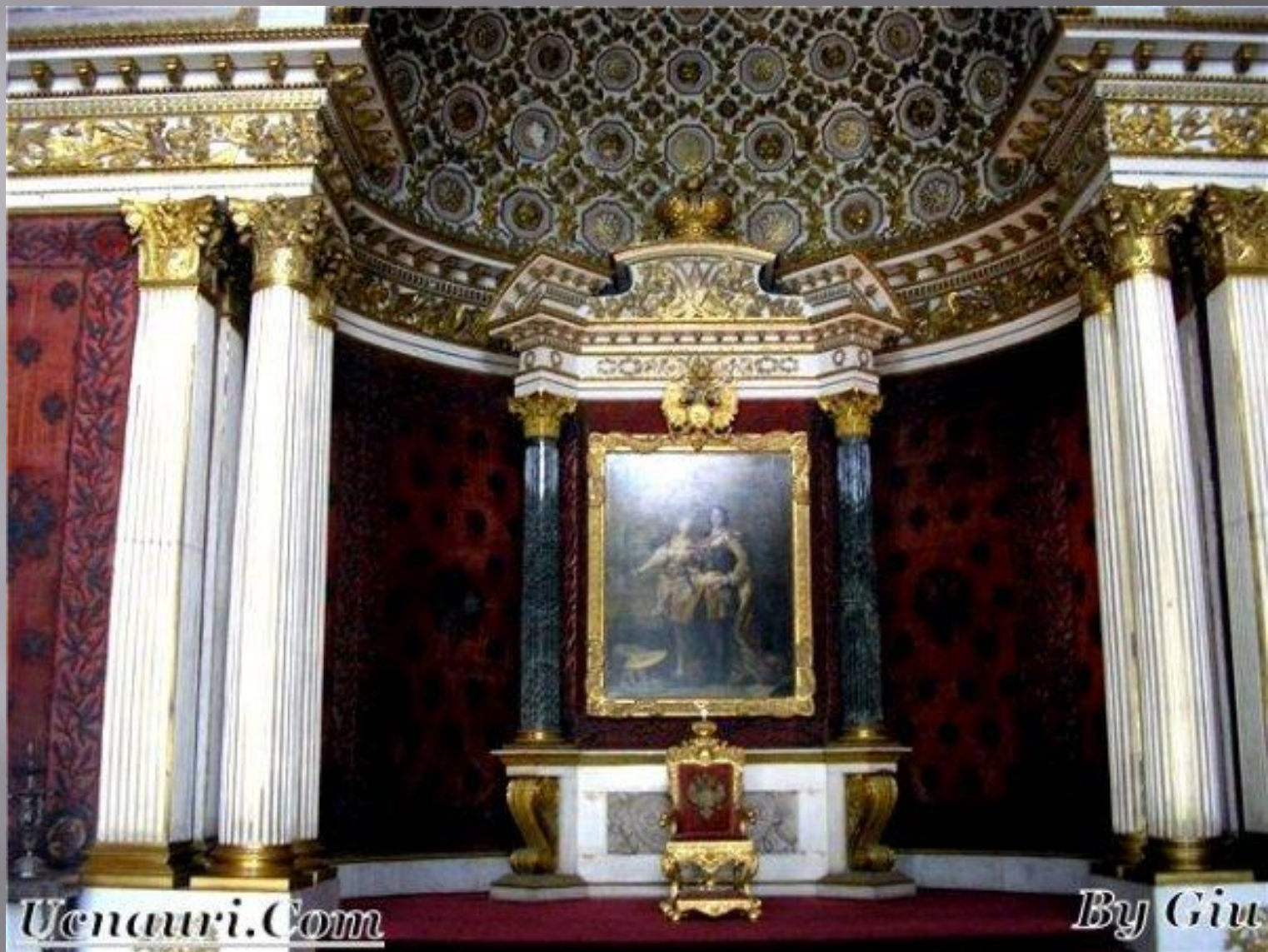
Петровский ( Малый тронный) зал