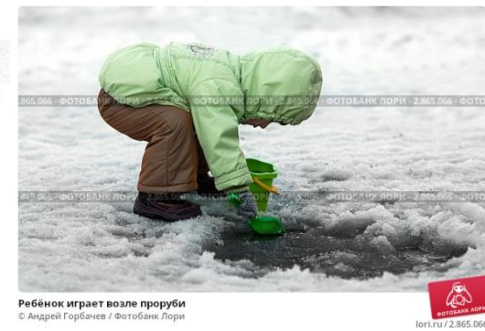
Ребёнок играет возле проруби

Вывод: Лёд прозрачный, хрупкий, скользкий и этим он опасен для человека, если не соблюдать осторожность.