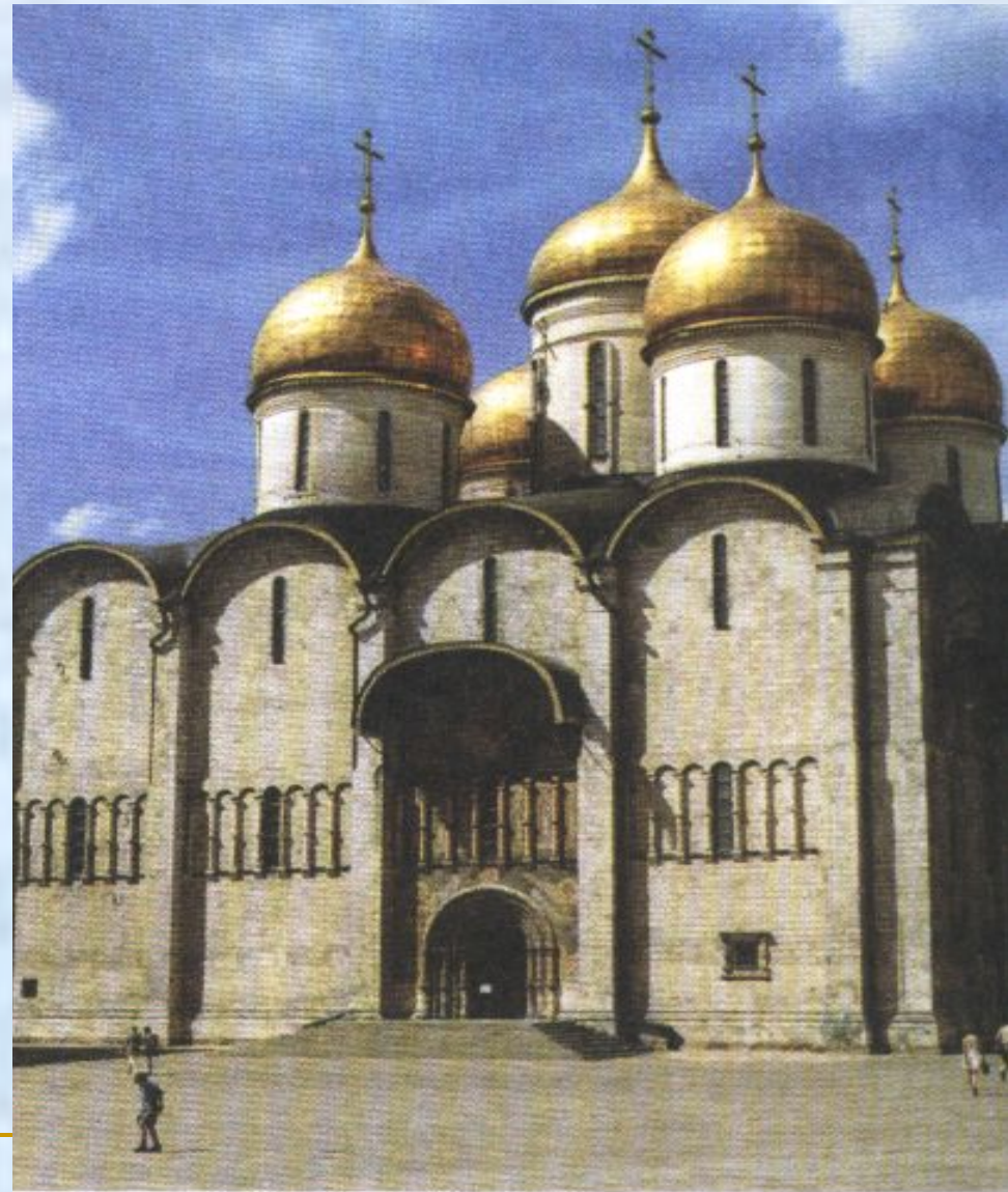
Успенский собор на Соборной площади в Кремле

Новый Успенский собор строил итальянский мастер Аристотель Фиорованти. Началось строительство в 1475г., а в 1479 г. собор был освящён.