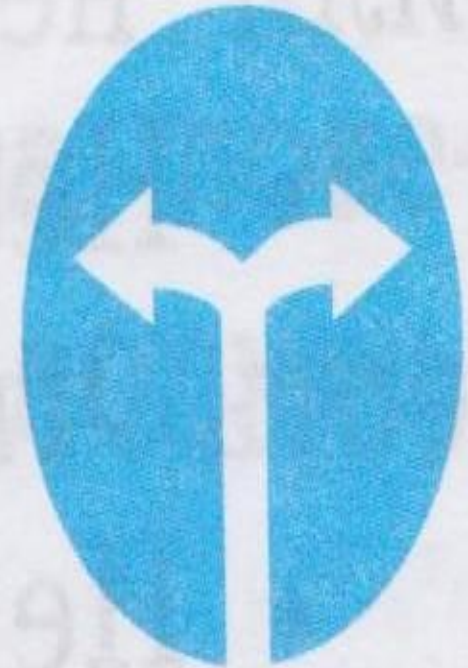
Движение направо или налево