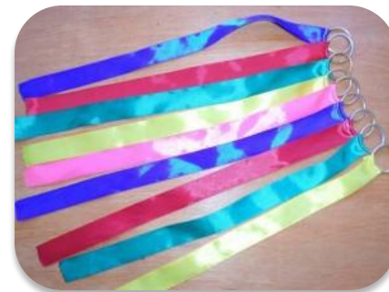
Платочки, ленточки, флажки