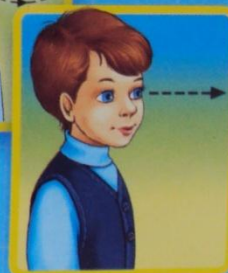
Гимнастика для глаз