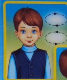
Гимнастика для глаз