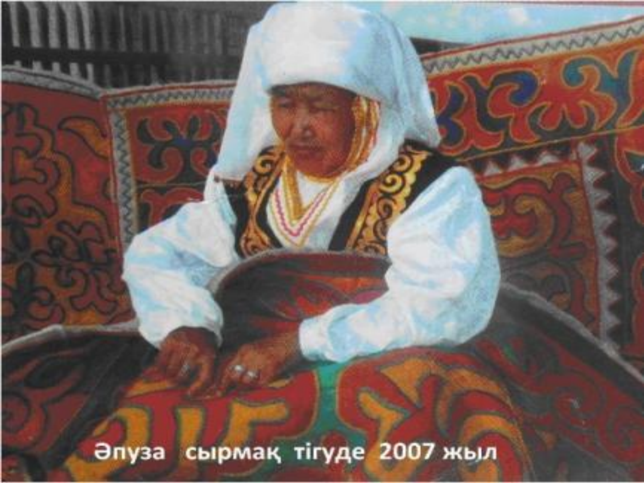
Әлуза сырмақ тігуде 2007 жыл