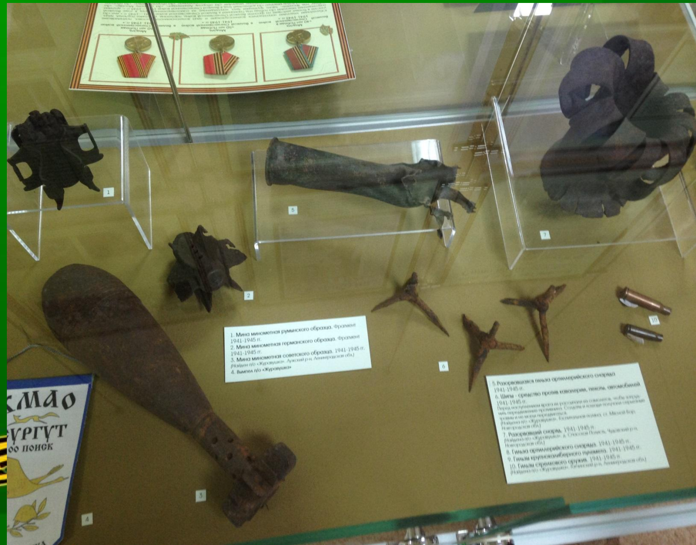
1. Мина минометная румынского образца. Фрозиное 1941-1945 гг. 2. Мина минометная германского образца. Фрозиное 1941-1945 гг. 3. Мина минометная советского образца. 1941-1945 гг. (Взрывил п/в «Журавушка». Луговой р-н, Ленинградская обл.) 4. Вышка п/в «Журавушка»