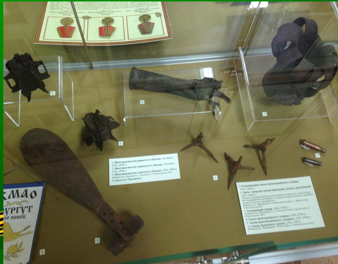
1. Мина минометна руминского образца. Фрозин 1941-1945 г. 2. Мина минометна германского образца. Фрозин 1941-1945 г. 3. Мина минометна советского образца. 1941-1945 г. (Видеи по «Журналист» - Лисий г-н, Довардский обл.) 4. Вышка по «Журналист»