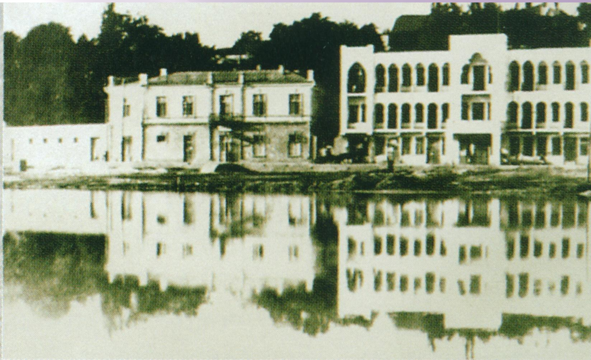
Дом Тихомирова. 1906 г.