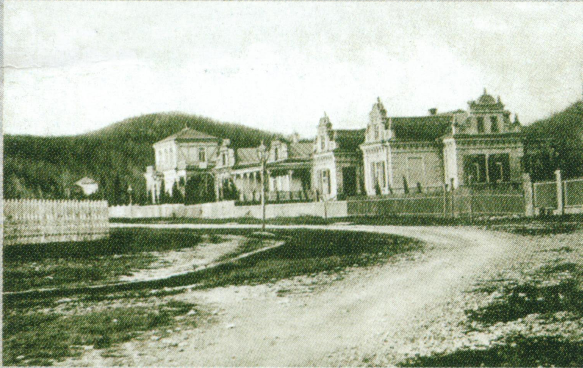
Улица Петра 1-го.