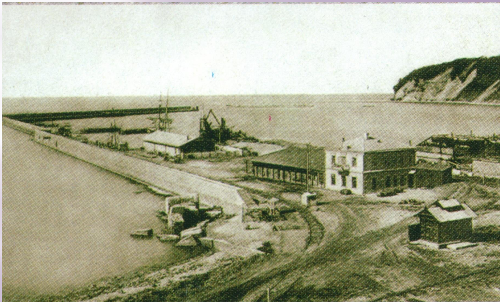
Порт Туапсе. 1914 год.

Одновременно с установлением железнодорожного сообщения был построен и оборудован новый коммерческий порт. К нему проложили нефтепровод из Майкопского нефтяного района.