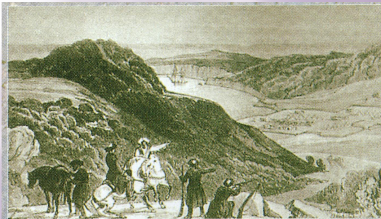
Вельяминовский Форт. 1838 г.

12 МАЯ 1838 ГОДА К УСТЬЮ РЕКИ ТУАПСЕ ПОДОШЛА ЭСКАДРА ЧЕРНОМОРСКОГО ФЛОТА ПОД КОМАНДОВАНИЕМ АДМИРАЛА М.П. ЛАЗАРЕВА. В СЕМИДЕСЯТИ САЖЕНЯХ ОТ МОРЯ НА ПРАВОМ БЕРЕГУ РЕКИ ТУАПСЕ НА КРЕПОСТНОЙ ГОРЕ БЫЛО ПОСТРОЕНО ВЕЛЬЯМИНОВСКОЕ УКРЕПЛЕНИЕ.