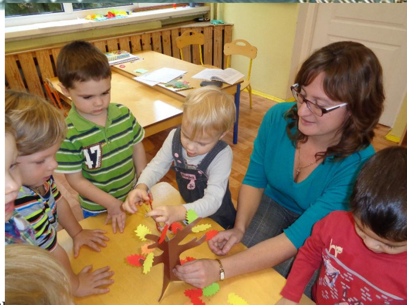
Аппликации «Осенние деревья»