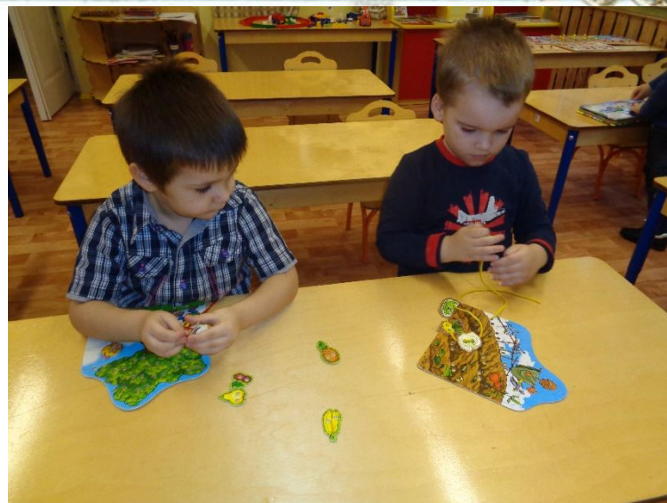
Игра – занятие «Шнурочки»