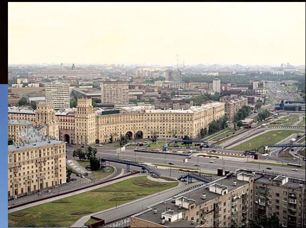
Площадь Гагарина в Москве