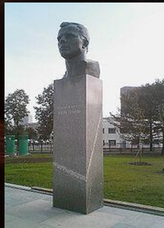
Памятник Юрию Гагарину в Москве