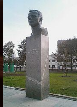
Памятник Юрию Гагарину в Москве