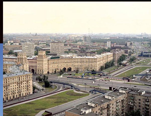
Площадь Гагарина в Москве