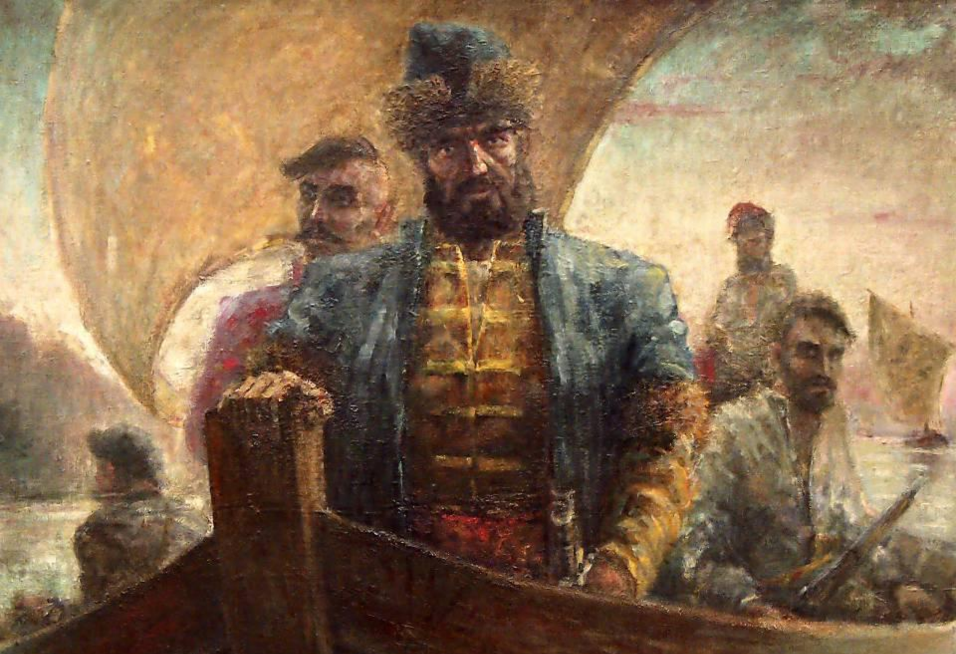
Художник: В. Копейко, «Ермак Тимофеевич».