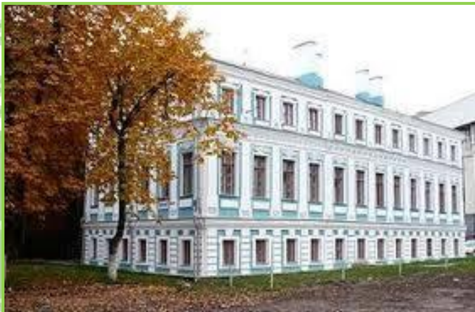
Дом-музей И. Никитина в Воронеже

Иван Саввич Никитин родился 21 сентября 1824 года в Воронеже. Отец его был торговцем - владел свечным заводом и лавкой.