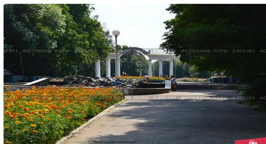
Орел, центральный вход в городской парк культуры и отдыха с видом