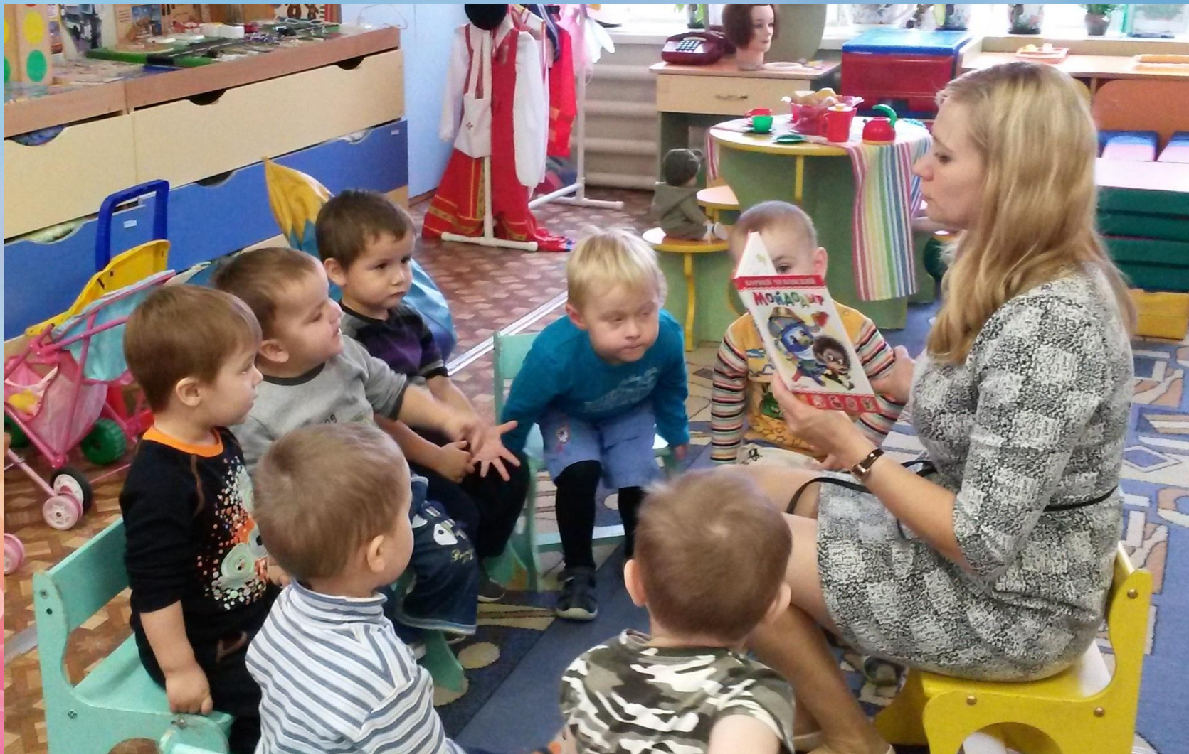
Предварительная работа-читаем сказку К. Чуковского «Мойдодыр»