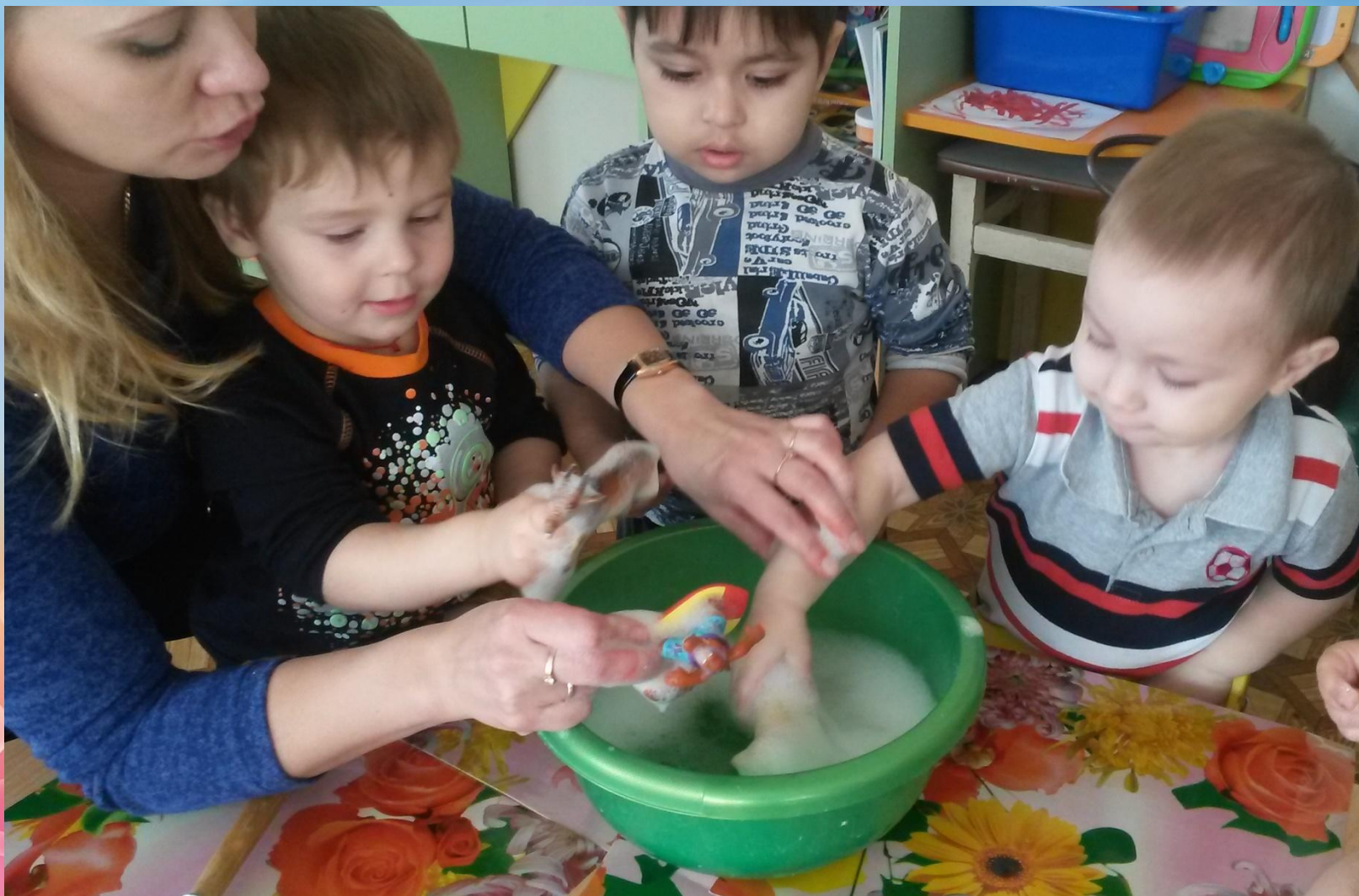
Игра-эксперимент- «Найди игрушку в мыльной пене»