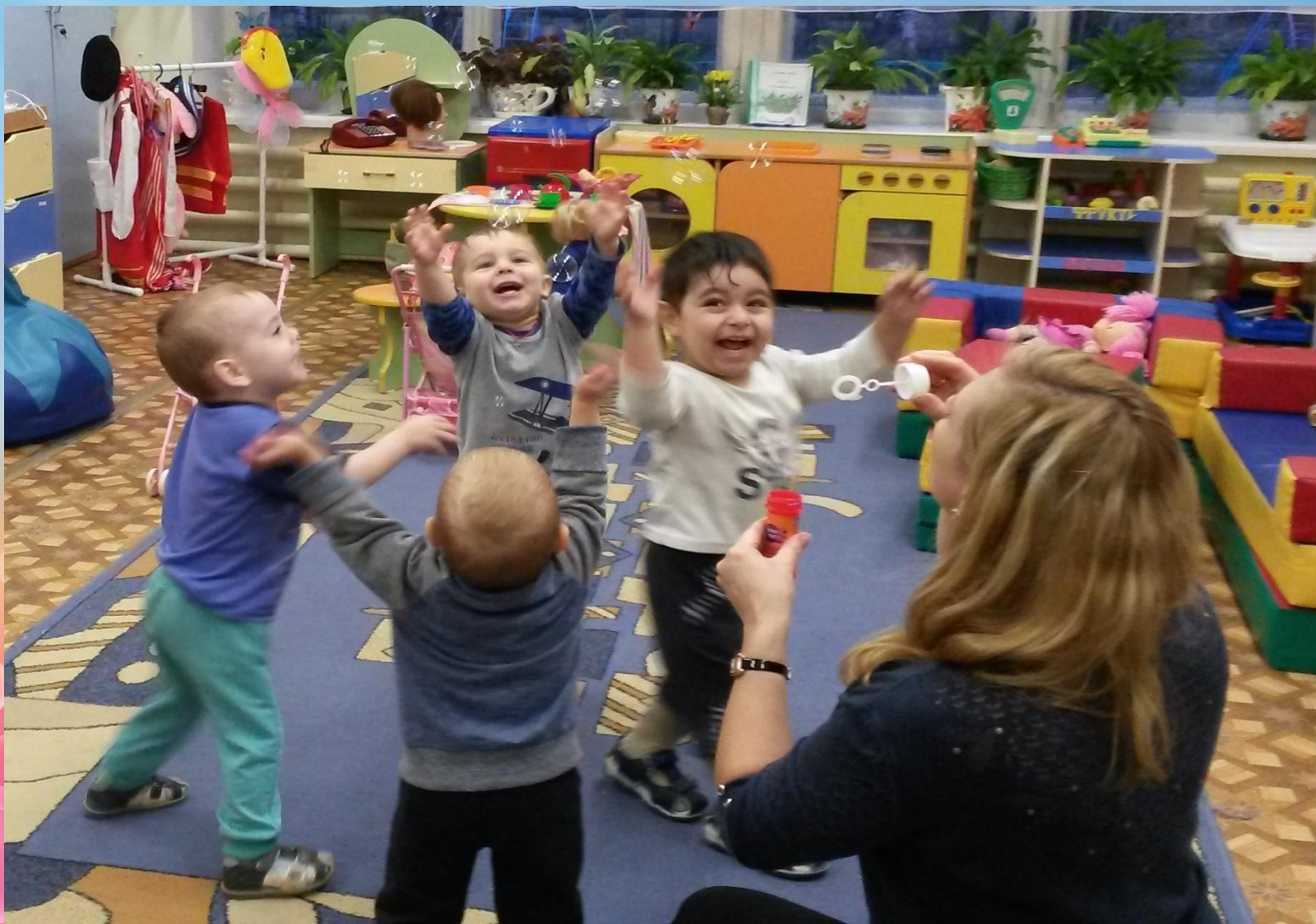
Игра-эксперимент- «Поймай мыльный пузырь»