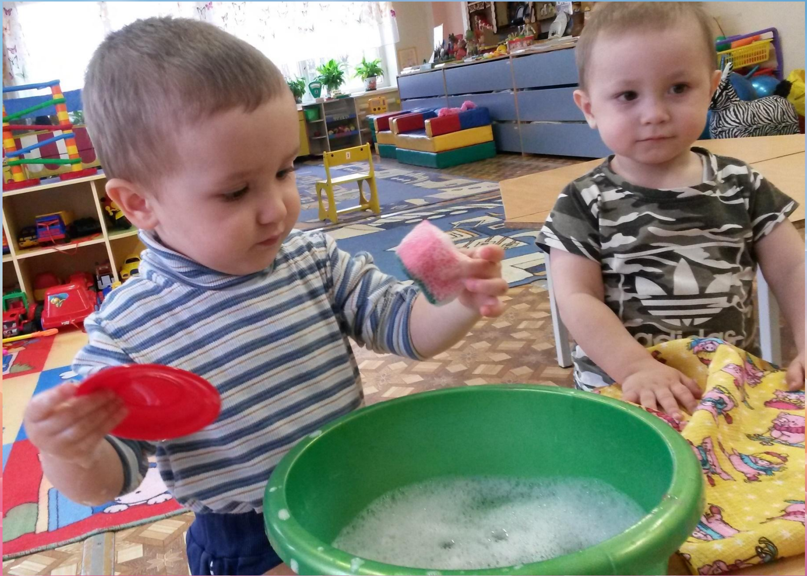
Игра-помощники Мойдодыра. Мою кукольную посудку.