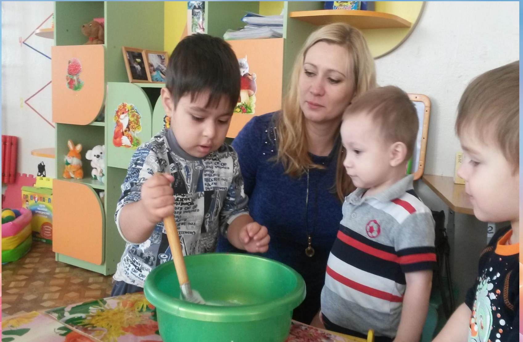
Взбиваем мыльную пену