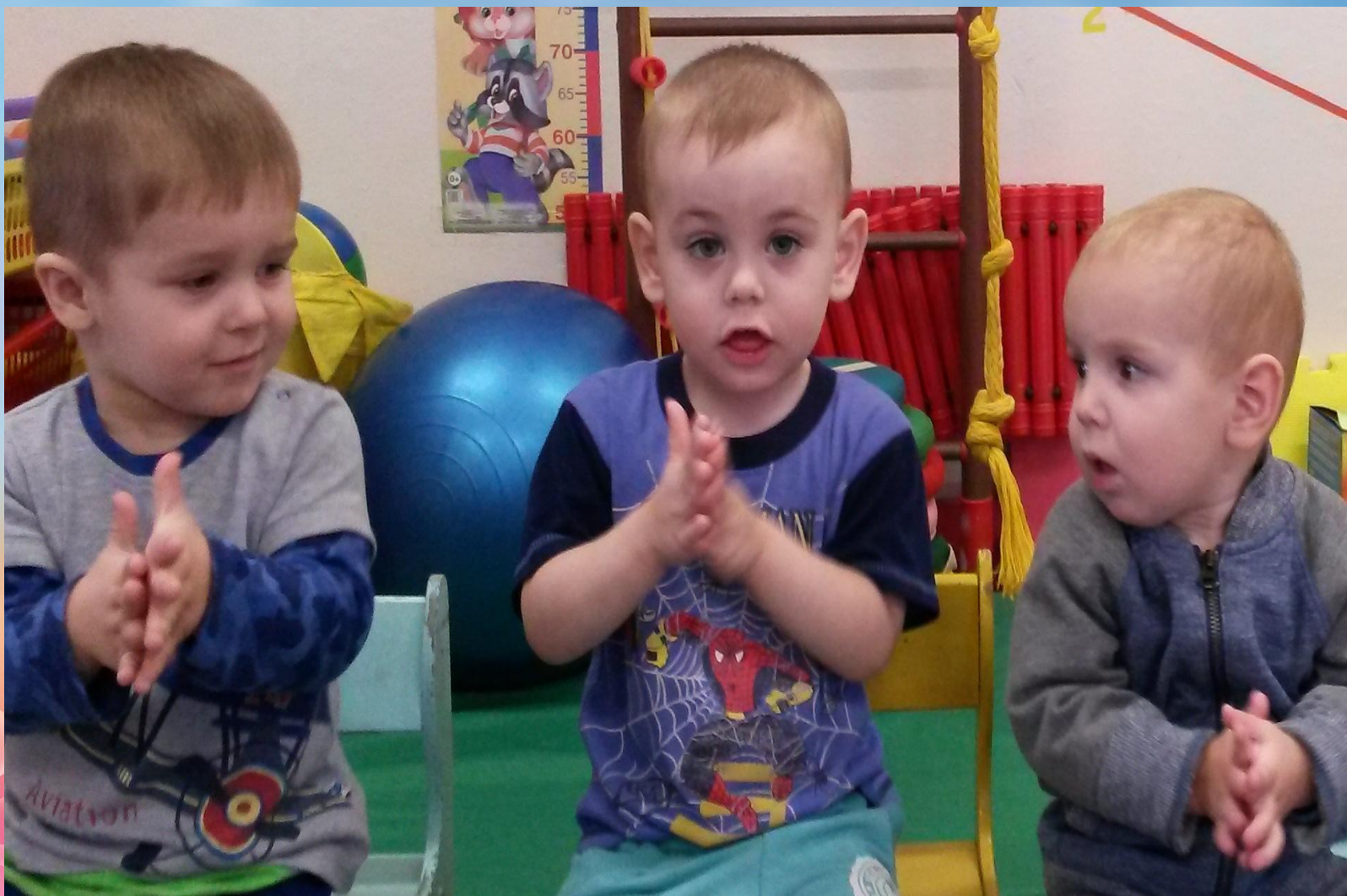
Пальчиковая гимнастика- «Умывалочка»