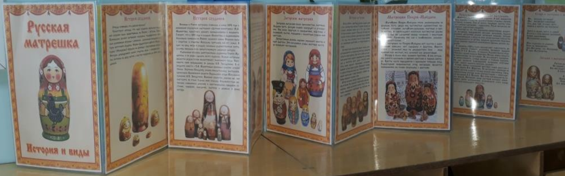
Папка-передвижка для родителей