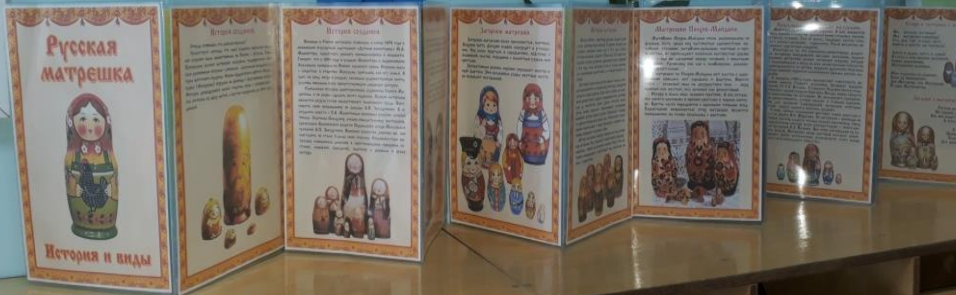
Папка-передвижка для родителей