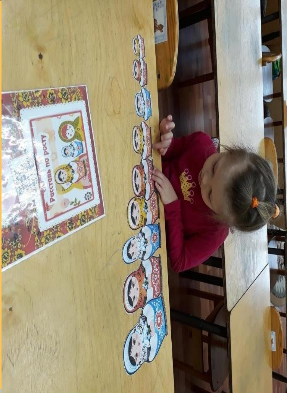
Расставь по росту